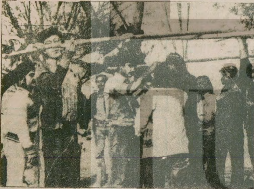
Bornova ve İnciraltı Yurtlarından çıkarılan öğrenciler çadır kurarken

Bilindiği gibi Nejedt Küçüktaşkın'ın 12 Mart döneminde tutuklulara işkence yaptığı gazetemizde ispat etmiş ve bu MİT ajanı hesabına 1 Mayıs katliamından 15 gün önce 8 milyon lira yatırıldığı belgeleriyle açıklanmıştı. Kontrgerilla elemanı olduğu ortaya çıkan Küçüktaşkın daha sonra İstanbul Barosundan ihraç edilmişti.