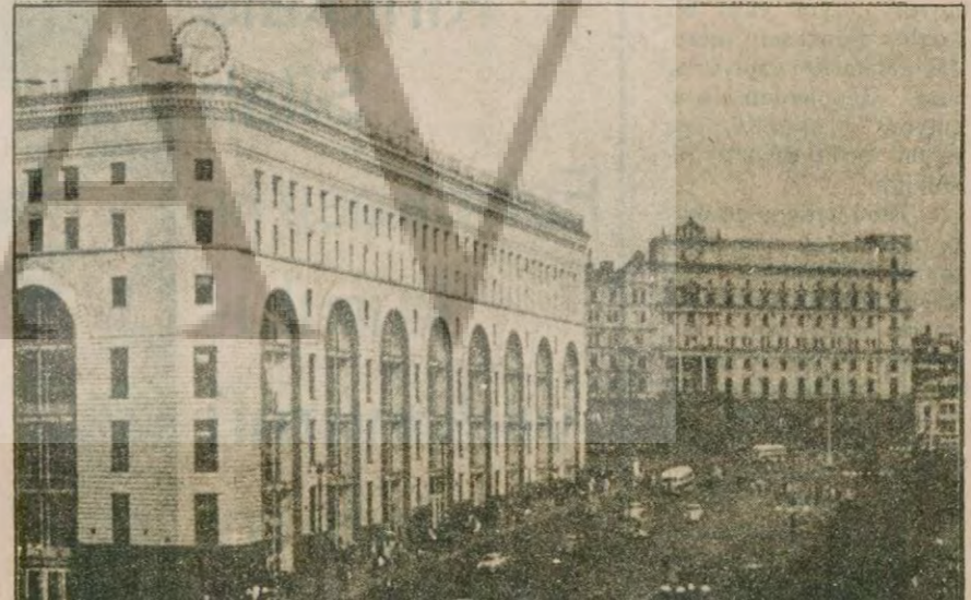
Moskova'daki KGB merkezi. KGB ajanlarının Rusya içinde çok etkin rolü var.