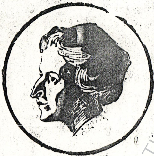
روزالور لومبرج Rosa Luxemburg...