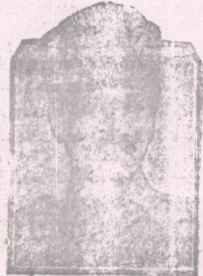
اکسپوزیور غزته سنده بیاناتی انصار ابدن تووکیا بووک ملت مجلسی رئیس مصطفی کمال پاشا

بگذرده آقره به اوروپا و آفریقا و بر جوق غزته لرینه بردن مختارک ابدن غزته بی کش ایلی - به ذاتک آقره به حاتم اولارق یا دینی شیلدن بهضیله بی بارسده منتشر (اکسپوزیور) غزته سنده اوردنک . مختارک مکتوب لرندن بری مصطفی کمال پاشا ایله ملاقاتندن باش و او زمانده ای بکدیگری تنظیمه هم حاتم اولارق واقع بوش اولوق حیدیه بو ملاقات شهیدی . ایله اسکیش هم اولونسه بیله مصطفی کمال پاشانک هر زمان ایچون اهمیت عیافتا . ده چاب اولان بعضی بیاناتی بوجه آتی ترجمه و نقل ایلیورن .