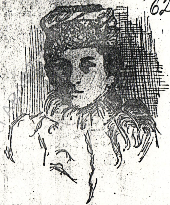
روزا لوكس بئورج ( بئورج ) Rosa Luxemburg.

۱۸۷۱ ده روس پولونيا سنده تولد ايمه - روزا لوكس بئورج را ۱۸ پلشنه ايلن فعاليت ياشيه - سنه ۱۸۹۰ مخولفن كورمه اولمدينه وظيفه ايرتمك . حياتك ايلك سنه لرينده اولن مفرده برماق بئورج بئورج ايمه اولاده كورديوز . زمانه مملكتده بويوله چراره سوكيال حاضري لوكس بئورج مملكتده تقوز ايتله باشلامك . بوميله داينسك ندر (Danzin) دن ايله اينداهي سوكيال پاتريوتيزم چراني ايمه . لوكس بئورج بوميله بئورج .