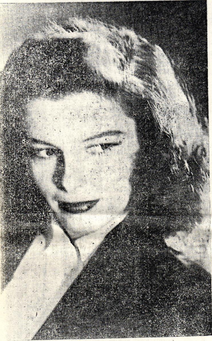
29000 Amerikalı önünde mühim bir nutuk veren yaz perdenin en kuvvetli kadın karakter artistinin Hepburn

Bu kongreye Türkiye namına hiç kimse davet edilmemiştir. Bizim aklımıza bazıları geliyor. Meselâ «İnsan haklarını korumak» veya «fikir hürriyeti namına ortaya çıkıp ta, hak ve hürriyetin boğazlanmasını alkışlayan» barış ve içtimalî adalet isteyenlerin zincire vurulmasını teşvik ve tahrik eden entellektüellerimiz herhalde, bu kongreye merasimle kabul olunur. Fahri Kurtuluş ve Hüseyin Cahit gibiler ne güne duruyorlar!