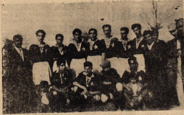
Ay — Yıldız takımının eski kadrolarından biri

Geçen Pazar günü Beykoz sahasında yapılan hususi maçlarda Beykoz Genç Takımı ile Ortaköy Genç Takımı karşılaşmışlar, maçı Ortaköylüler (5-3) kazanmışlardır.