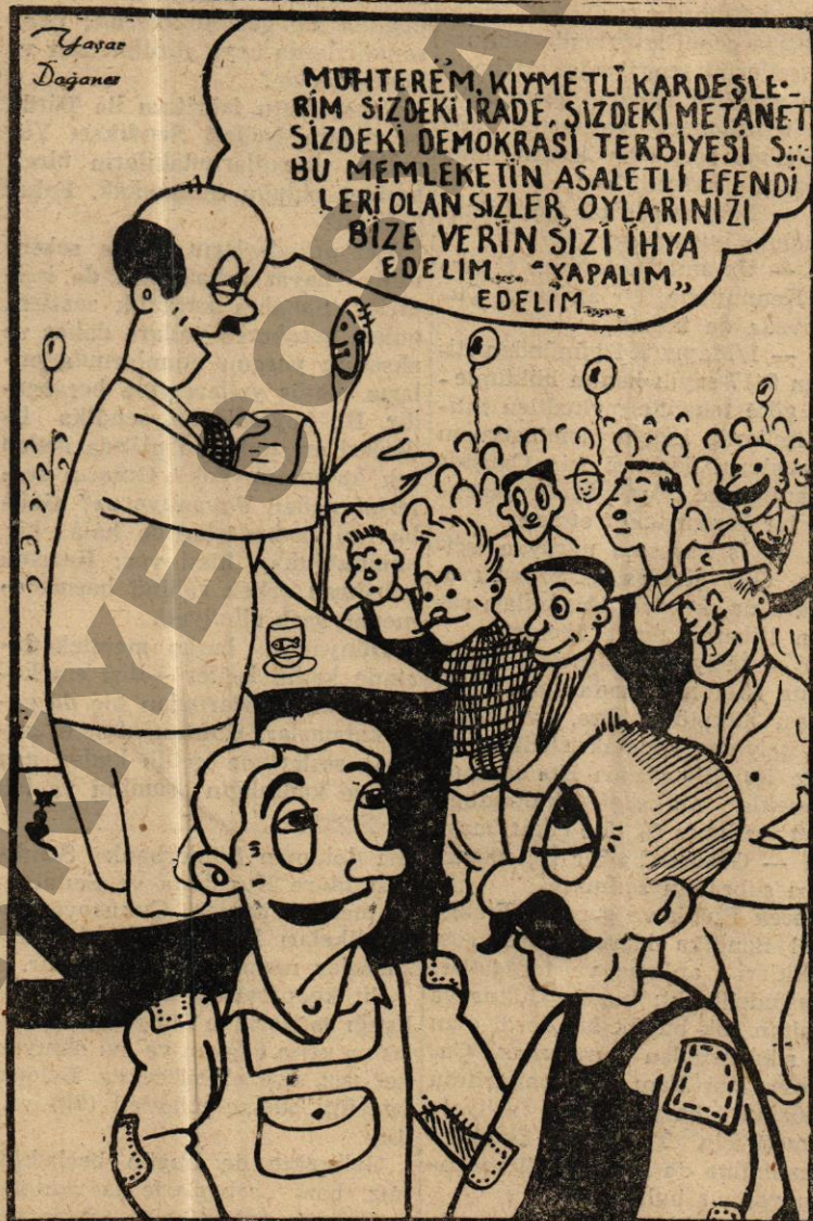
— Seçim yaklaştı da iltifata başladılar...