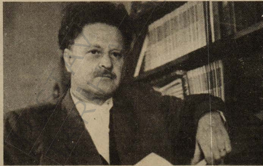
NÂZİM HİKMET—Nâzım şimdi yurtdışında, vatandaşlıktan çıkarılmış, ünlüler mezarlığında yatıyor.

"Cumhur Reisi Atatürk'ün Yüksek Katına Türk Ordusu'nu 'isyana teşvik' ettiğim iddiasıyla on beş yıl ağır hapis cezası giydim.