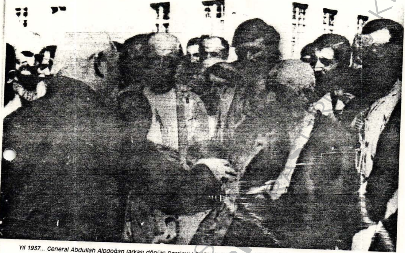
Yıl 1937... General Abdullah Alpdoğan (arkası dönük) Dersimli köylülerle konuşuyor: "Üç şey istiyoruz. Asker, vergi, itaat..."

gün genç kuşaklar, neredeyse Dersim adını bile bilmiyordu. Bugünü anlamamanın anahtarı olan "dün" unutulmuştu.