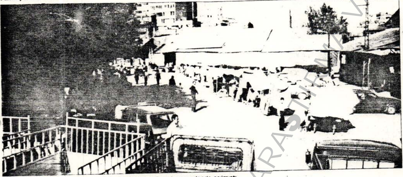
Seyit Rıza'nın da aralarında bulunduğu 11 kişi 50 yıl önce bu meydanda asılmıştı

Değirmen taş'ın oraya götürdüler. Bize, silahlarımızı toplayıp serbest bırakacağız diyorlardı. Ama bizi çay kıyısına götürüp öldürdüler. Kocamı da öldürdüler. Biz üç kişi