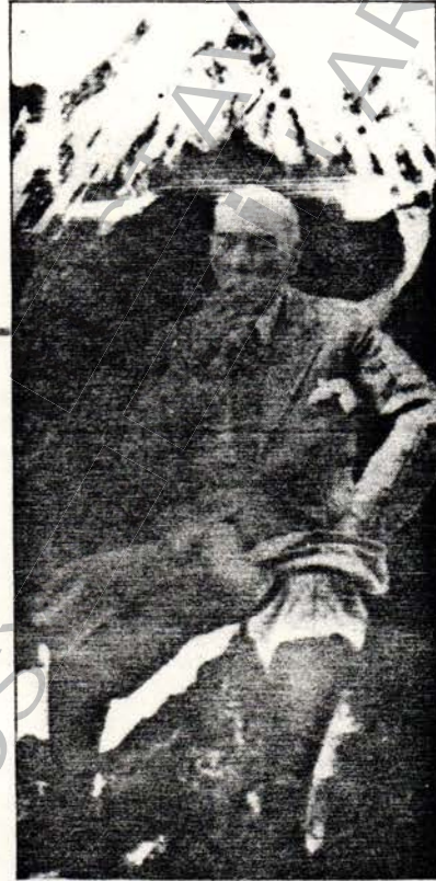
Atatürk, 1937'de Tunceli'deki Singeç Köprüsü'nün açılışını bizzat yapmıştı

Gökçen: Ufak bir azınlığın ayaklanması neticesinde bu harekâta gerek duyulmuştur, ve kısa