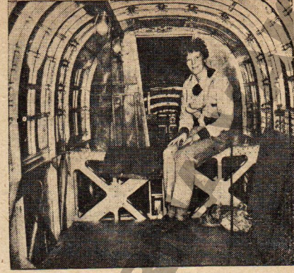
Amerikan uçakçısı Amelia Earhart uçağı içinde.

Sinemasılık artık çabuk dönen bir lanterne magique halinden çıktı, tekemmül ettikçe etti, yalnız makine olarak değil, çeşit nevi olarak da: seslisi, renklisi ve canlısı (sinéma en relief) da vardır. Sinema tiyatrounun kör muhallidi halinden çıkıp ses sanatı, renk sanatı ve kabartı, kitle sanatı oldu. Bir yandan fiziğe, bir yandan dekora ve mimariye dayanıyor. Tabiatıyla sinemalar alelâde temiz ve büyük salonlar şeklinden çıkıp sesin, rengin ve ışığın sanat maksadına en çok hizmet edebileceği şekillere giriyor. Bir sinema mimarisi doğmuştur. İki zaruret bu yeni salonlara uzvî bir şahsiyet veriyor: divar ve tavanların sesi en iyi dağıtır biçimde olması, ışığın gerilerden ekrana doğru git gide çoğalması. Orta Avrupa ve Amerika Birleşikleri'nde bu cinsten fevkalâde salonlar yapılmıştır. Resmimiz New York'da Radio - City Music - Hall'in salanunu gösteriyor.