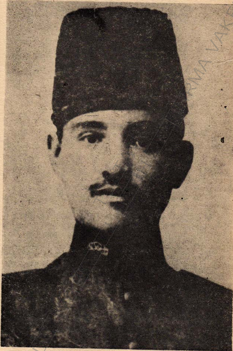
1912'de izinli olarak Küçük Zabıt Mektebinden geldiği vakit, S.N.'nın Gelibolu'da çekilmiş bir resmi.