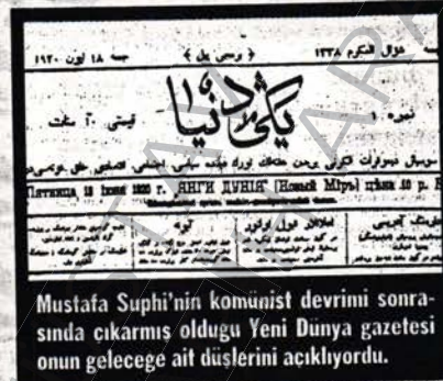
Mustafa Suphi'nin komünist devrimini sonrasında çıkarmış olduğu Yeni Dünya gazetesi onun geleceğe ait düşüncelerini açıklıyordu.

Mustafa Suphi'nin hayatı sürgünlerde geçmişti. İttihat ve Terakki iktidarına karşı özgürlükçü muhalefet içinde yer alması nedeniyle, bu parti hükümeti tarafından 1913 yazında Sinop'a sürgün edilmişti. Ertesi yıl Çar