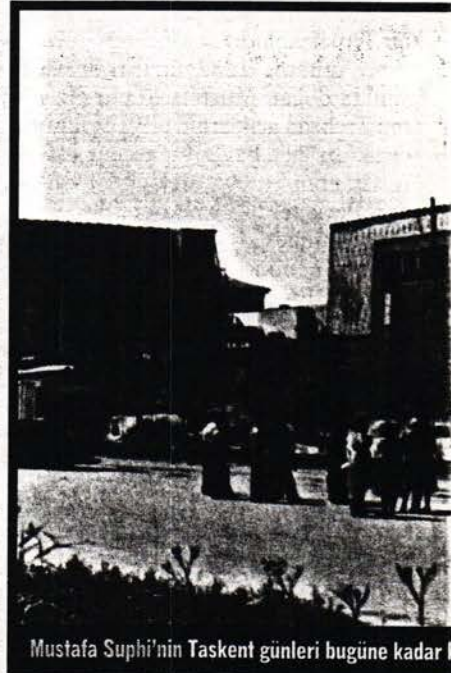
Mustafa Suphi'nin Taskent günleri bugüne kadar k

Türk devrimcileri Avrupa'nın yalancı vaatlerine tabiatıyla pabuç bırakmayacaktır. Bizler son yüz yıllık Tanzimat ve İslahat dönemlerinde, Avrupa medeniyetine uygun muntazam bir hükümet, kuvvetli bir ordu kurmayı başardığımız halde emperyalizmden nasıl bir destek ve güvenceye nail olduk ki; şimdi şu perişan halimizle boş sözlere ve yalancı ümitlere bel bağlayalım. 10 Temmuz devrimi bile kapitalist Avrupa nazarında bizim hayatta kalma hakkımızı ispat etmedi demek anlamına gelir ki; bizim için herhangi bir hükümet şekli ve ıslahat ile hayatta kalmak ve bağımsız olmak mümkün değildir. Bizim için