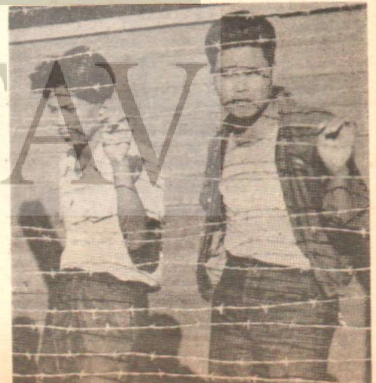
Filipinlerde demokrasi (!) kurbanı devrimciler

son günlerde giriştiği bilinçli eylemler ve gittikçe artan hoşnutsuzluk karşısında, sahte demokrasiyle birlikte, Marcos ve benzerleri gerçek bir «hatıra», hem de kötü bir hatıra haline gelecektir.