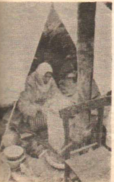
BİR FELAKET ÇADIRI — Konuttan daha güvenli —

Elbet birgün o sınıf, mensuplarıyla ve usaklarıyla tarihin sancık sandalyesine oturtulacaktır.