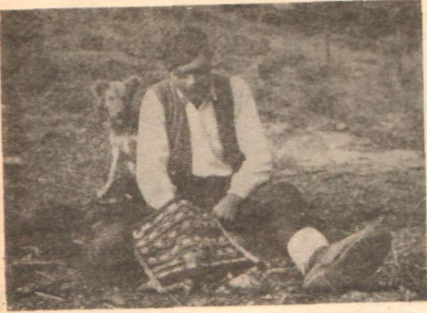
YARI AÇ YARI TOK ORMAN KÖYLÜSÜ — Batıda da, Doğuda da kaderi aynı —