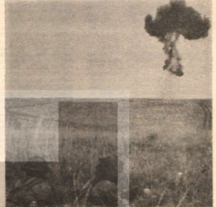
NÜKLEER SILAH PATLATILIYOR

İşte bu noktada bu meselenin muammalarından biri karşımıza çıkmaktadır: Gerçekten işleyen nükleer silahların imaline devam edebilmek için Bloemfontein'de geliştirilen prototiplerin denenmesi gereklidir. Almanlar ve Güney Afrikalılar bunu, dinleme ve gözetleme istasyonlarının gözünden nasıl kaçıracaklardır? Afrikadaki geniş açık sahalar ve büyük yeraltı mağaralarına rağmen buralarda yapılacak nükleer denemeler, iki büyük nükleer devin yer yüzünü kuşatan gözetleme sistemlerince tespit edilecektir. Bu ancak iki devden birinin deneme yapılan