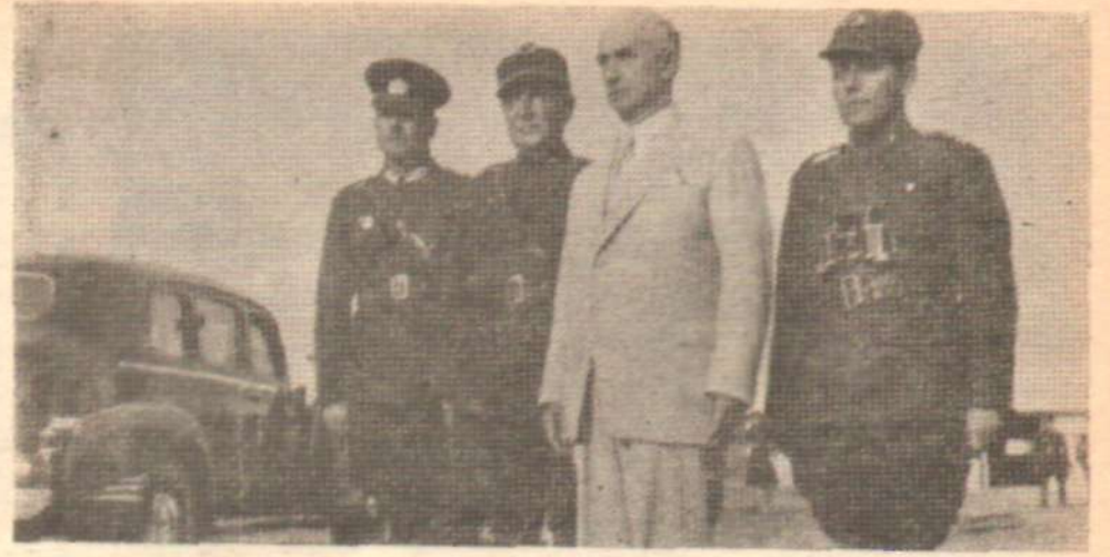
MİLLİ ŞEF, DİKTATÖRLÜK YILLARINDA — Devrimcilik adına devrimcilere engizisyon işkencesi —