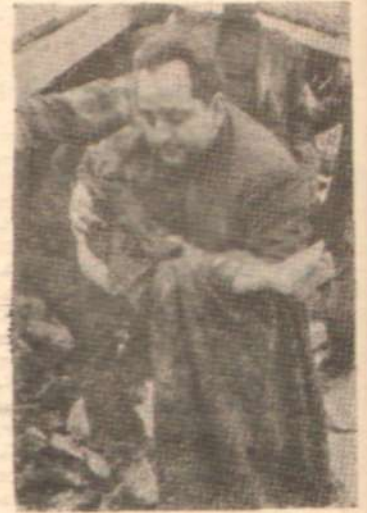
YAVRUSUNUN ÖLÜSÜNÜ TAŞIYOR — Sadece takdiri ilâhî mi? —