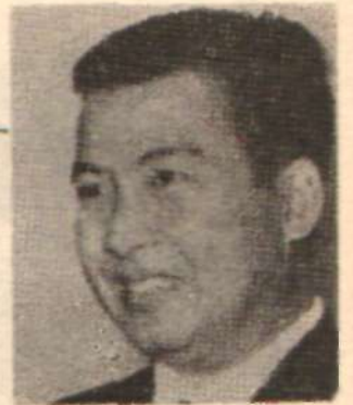
Tarafsızlığının kefareti ni ödeyen Prens Sihanuk (üstte) Emperyalizmin kuldası Lon Nol (altta)

VE EMPERYALİZM GÜNEYDOĞU ASYADAN SÜRÜLECEKTİR.