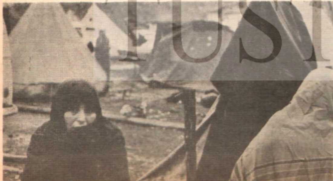
Felaketten canını şimdilik kurtaran bu kadın artık aç ve açığa kalmayacak mı?

Bu işte keresteci vurmuş, malzemesi vurmuş, nakliyecisi vurmuştur. Varto'da yaptırılan 1044 barakanın her biri 3.501 liraya mal olacakken mütteahhitlere 6.000 liraya ihale edilmiş, mütteahhitler bir kaleme 2.607.912 lira çarpmışlardır.