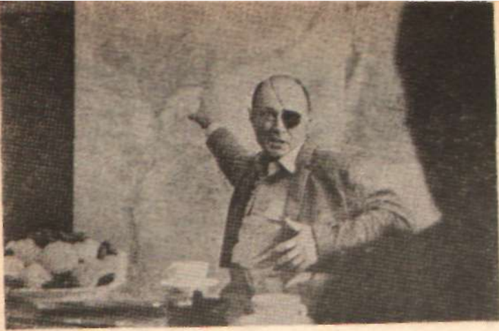
ISRAİL SAVAŞ ÇİLGİNİ MOŞE DAYAN — 30 yıl öncesi dahi hatırlamaz oldular —