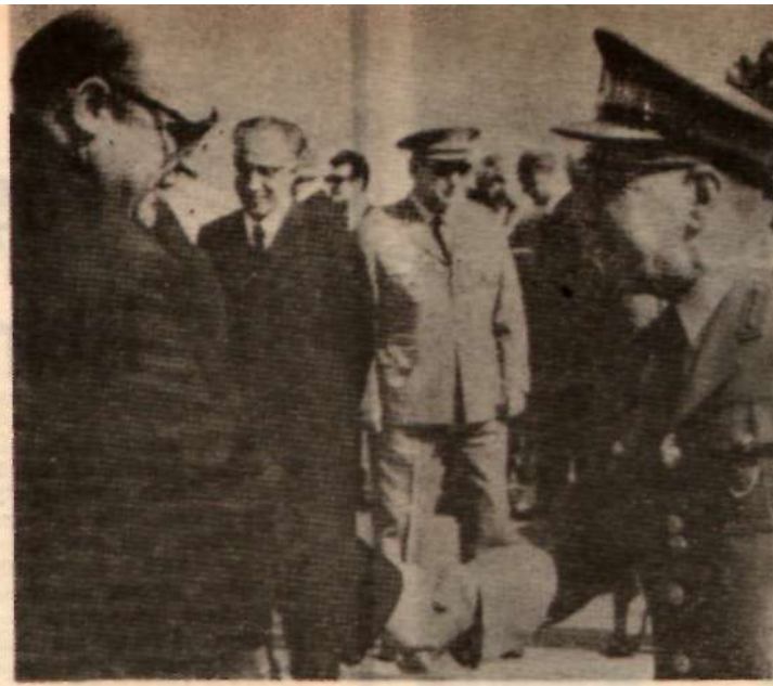
Devrimci gençlik emperyalizme karşı Türkiye'nin çıkarlarını savunurken (altta) Genelkurmay Başkanı Org. Memduh Tağmaç ile Başbakan Demirel, gençliğe karşı husumet paktı yapılıyor (Selda)

D EVİRİMCİ gençlik, geçen hafta Kıbrıs konusunda emperyalizme ve işbirlikçilerine karşı direnişini sürdürürken, bugüne dek üstüne toz kondurulmayan «küçük burjuvazinin asker kesiminden ağır bir darbe yemiştir. Özellikle «milli demokratik devrim» yada «milli demokratik hareketlerin» vuruşu, hatta öncü gücü olarak küçük burjuvazinin asker kesimini görenler için, gerek Milli Güvenlik Kurulu'nun yayınladığı bildiri, gerekse sivil mahkemelerin dahi serbest bıraktığı gençlik liderlerinin askeri mahkemelere tutuklanması tam anlamıyla bir şok olmuştur.