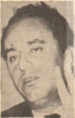
BILGEHAN — Müftis iktidar —

«Millî gelirdeki artışların halk farkında olamamaktadır. Gelir dağılımındaki sosyal adaletsizlik bu neticeyi doğurmaktadır. Fiyatlar son yıllarda adanıklılı artmıştır. İstanbul'da gıda maddelerindeki artış yüzde 18,2, Ankara'da yüzde 8,3'tür. Bu aradaki fiyat farkı, yüksek ekonomiyi hâkim olacaktır. Ayrıca bu fark, aracılara fahiş sayılabilecek kâr elde ettiklerini göstermektedir.»