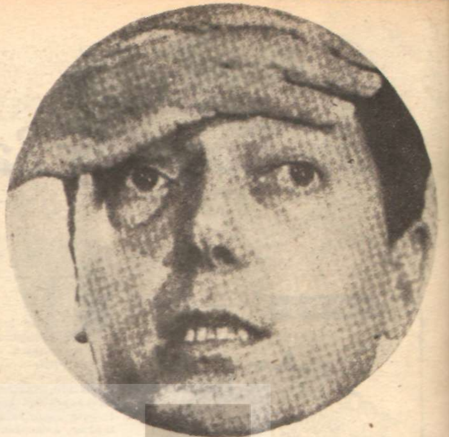
GARRISON — Gerçekleri açıklıyor —