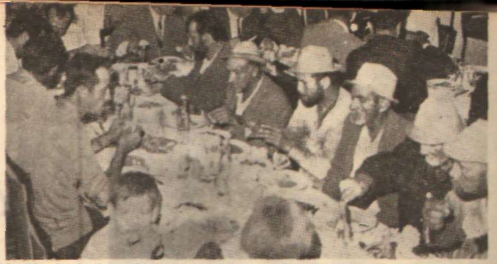
Sendikacılar bugün işçiden tamamen kopmuştur. Resimde, grev yapan Manisa'lı temizlik işçilerine verilen yemekte ayrı bir masa kurarak buzdu biralar için sendika ağaları görülmüyor.

G özler, bütçe müzakerelerine çevrilmiş, A.P.'li sendikacı milletvekillerinin konuşma fırsatını nasıl değerlendirecekleri yeniden merak konusu olmuştur. İşçilere çeşitli zorluklar, hak kayıpları, işten çıkartma, aç bırakma, idareyi siyasi iktidarın oyuncağı hâline getirme yollarını bir kerre daha açan toplu sözleşme yasasının sonuçlarını bakalım sendikacı A.P'liler nasıl savunabilecekler? Ya da işçiyi işçiye karşı çıkaran sendikalar yasasını, Çalışma Bakanlığı bütçesi sırasında nasıl eleştireceklerdir.