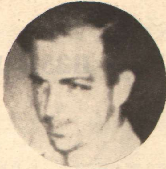
OSWALD — Marksist değil, ajan! —