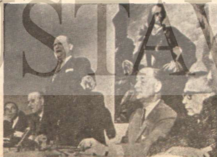
Yeni Nazi Partisinin liderleri bir toplantıda

Burada oldukça önemli olduğuna inandığımız bir noktaya değinmek istiyoruz. Alman halkının bütünü, en az sekiz senelik bir temel öğrenimden geçmiş olmalarına rağmen, kapitalist ülkelerde eğitimin temel özelliği sonucu, dünya olaylarını değerlendirebilecek bir görüş açısına sahip değildir. İlk öğretimin (8 yıl) amacı ekonominin için gerekli kalifiye işçiyi eğitmektir. Alman nüfusunun yüzde 47'si işçilerin teşkilatlarına rağmen, üniversitelerde okuyan öğrencilerin ancak yüzde 3 ü işçi ailelerinden gelmektedir. Bu işçi sınıfı arasından yetişen gençlerin yüzde 97'sinin iş hayatına