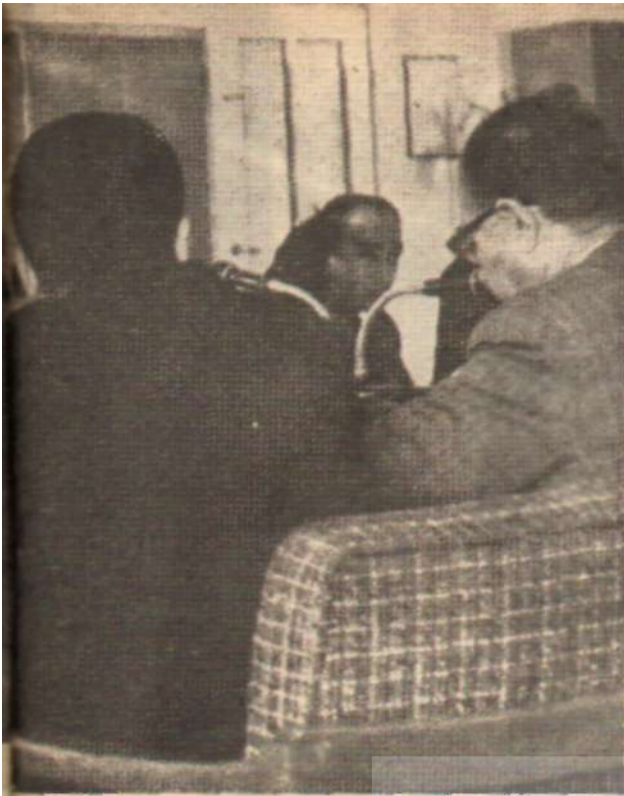
Bağcıoğlu Komisyonu faaliyetinde...