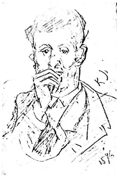
Bilder 24, 25. Porträt-Skizzen zweier unbekannter Männer, Bleistift, 12 x 7,5 cm, signiert «K. J. 1876», Inv. Nr. 300 und Inv. Nr. 305.

auch verkleinerte Aquarellkopien von verschiedenen Szenen der Bilderzyklen an. Jauslin setzte sich für die Erhaltung der Fresken ein, doch wurde beschlossen, sie abermals zu übertünchen. Allein die Darstellung des jüngsten Gerichts an der Westseite des Langhauses blieb davon ausgenommen. Jauslin wurde beauftragt, es zu restaurieren. Dass Jauslin dies im Sinne von «übermalen» tat, mag seinerzeit kaum Anstoss erregt haben.