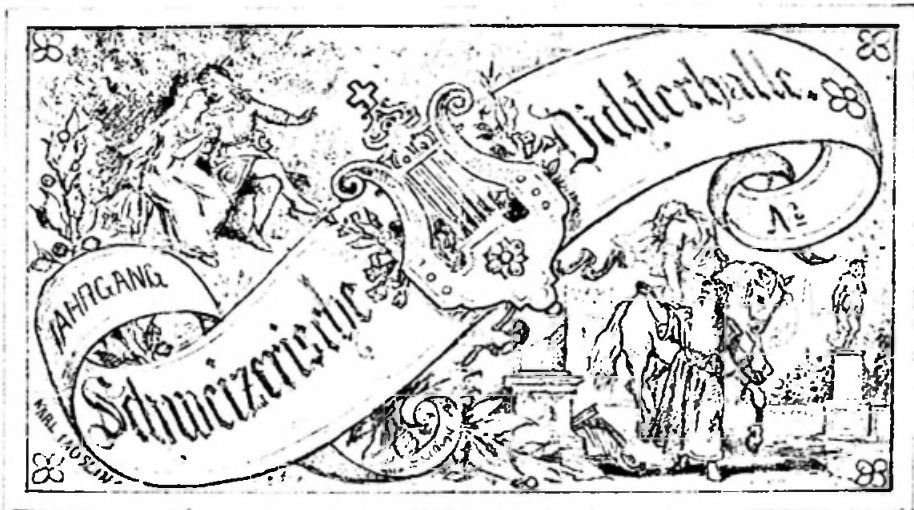
Bild 12. Entwurf zur Titelvignette der Zeitschrift «Schweizerische Dichterballe», Bleistift, 7,5 x 12,5 cm, signiert «KARL JAUSLIN», Inv. Nr. 1465.

dürften ihnen als Vorbild gegolten haben. Die dargestellten Themen waren bunt gemischt und zum Teil von anerkannten Künstlern gezeichnet worden. Die Grenzbesetzung im Winter 1870/71, historische Schlachten und Szenen aus dem Volksleben, alle Themen waren betont schweizerisch 32 . Dass die Bilderbogen nicht den erhofften Absatz fanden und deshalb bereits nach der 24. Nummer wieder eingestellt werden mussten, war wohl für alle Beteiligten eine grosse Enttäuschung. Jauslin beklagte sich bitter über das Unverständnis seiner Landsleute, da sie nicht bereit waren, ein derartiges patriotisches Unternehmen zu unterstützen.