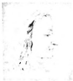
Bild 5. Bildnis eines Mädchens aus dem Skizzenbuch von 1868, Bleistift, 10,5 x 17 cm, Inv. Nr. 2104.

Vom Malunterricht ist ein Beduinenkopf im Nachlass vorhanden. Es ist das Porträt eines alten bärtigen Mannes mit einem um das Haupt geschlungenen Fez. Die Kunstschüler wohl aller Akademien jener Zeit hatten derartige Studienköpfe zu malen. Die Modelle mussten möglichst exotisch kostümiert sein, was als «malerisch» und somit als besonders malwürdig angesehen wurde.