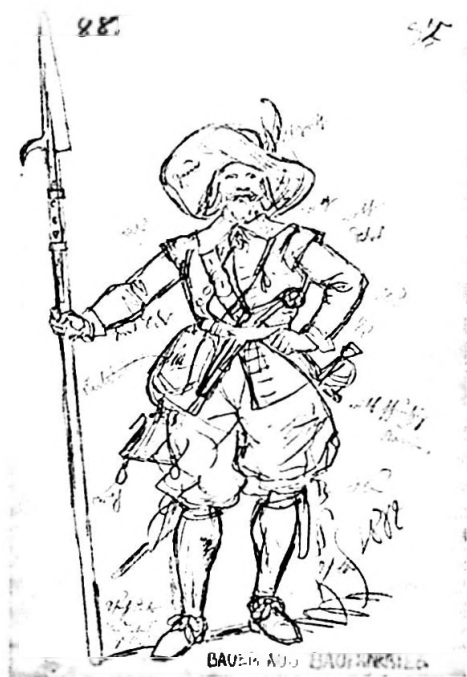
Bild 8. Kostüm-Skizze für den Festumzug Bern 1882, «Bauer aus Bauernkrieg», mit Farbangaben, Bleistift, 21 x 13,5 cm, signiert «K J 1882», Inv. Nr. 1916.