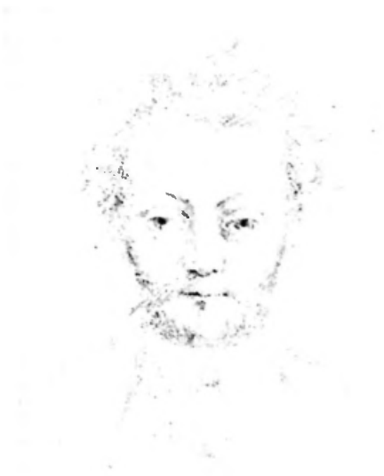
Bild 2. Selbstbildnis aus dem Skizzenbuch von 1868, Bleistift, 10,5 x 17 cm, Inv. Nr. 2104.

Kindheit und frühe Jugendzeit Jauslins verliefen bewegt. Der Ortswechsel bedeutete auch Schulwechsel; dazu kamen die unruhigen und unsicheren wirtschaftlichen und politischen Verhältnisse, mit denen der Vater durch seinen Beruf oft konfrontiert wurde und die sich dem Knaben durch mancherlei aufregende Erlebnisse einprägten. Vor allem alles Militärische, wie durchziehende Truppen, kämpfende Soldaten, Deserteure, bunte Uniformen und blanke Waffen machten ihm Eindruck.