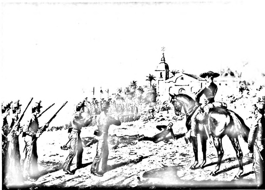
Bild 23. Erschiessung Kaiser Maximilians von Mexiko, Kohle und Tempera auf Papier/Leinwand, 150 x 200 cm, signiert «K. JAUSLIN, September 1903», Leihgabe des Bundes, Departement des Innern.

Die Luzerner Bilder sind mit weisser Tempera gehöhte Kohlezeichnungen, im Format von 1,5 x 2 Meter 54 . Der als Bildträger dienende Karton ist im Laufe der Jahre nachgedunkelt, was ihnen einen düsteren Charakter verleiht. Dargestellt sind kleinteilig und detailliert gezeichnete Massenszenen, die der Betrachter nur bei näherem Herantreten in allen Einzelheiten würdigen kann. Streng genommen handelt es sich um Graphiken, um Zeichnungen in überdimensioniertem Format.