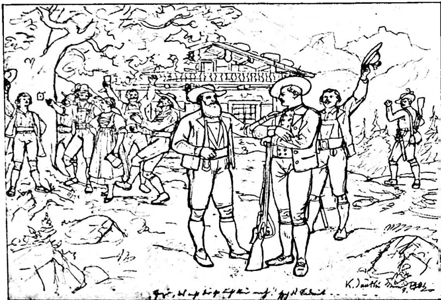
Bild 9. Vorlage für Kalenderillustration, Bleistift, Blattgrösse 22 x 36 cm, signiert «K. Jauslin Juni 1901», Inv. Nr. 2137.

In ihrem Format entsprechen die gezeichneten Vorlagen nur selten den gedruckten Bildern. Der Holzstecher (Xylograph) übertrug die Zeichnung mit Hilfe eines Rasters in verändertem Massstab seitenverkehrt auf den Holzstock.