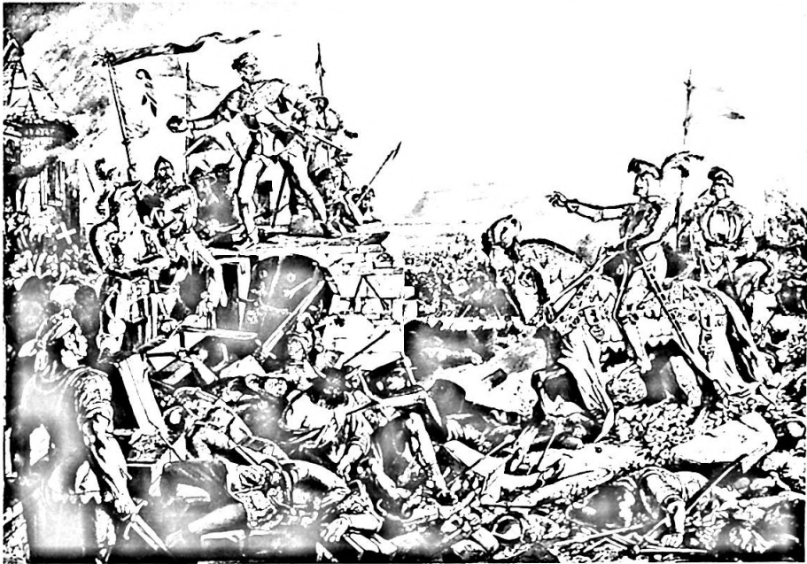
Bild 16. Schlacht bei St. Jakob an der Birs. In: Bilder aus der Schweizergeschichte. Basel 1897, signiert im Druck «KARL JAUSLIN 1893».

der an. Besonders deutlich sind stilistische Anklänge an die Deutschen Alfred Rethel (1816—1859) und Moritz von Schwind (1804—1871) und an die Schweizer Ludwig Vogel (1788—1879) und Martin Disteli (1802—1844).