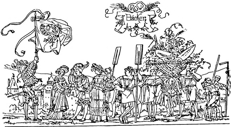
Bilder 6, 7. Ausschnitte aus dem Festumzug Schaffhausen 1885, Inv. Nr. 2134.