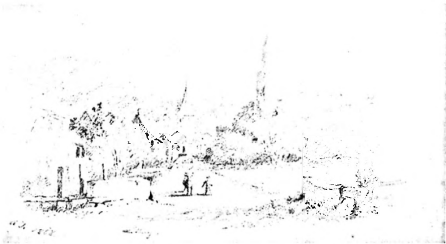
Bild 1. Ansicht von Muttenz aus dem Skizzenbuch von 1868, Bleistift, 10,5 x 17 cm, signiert «K J 1868», Inv. Nr. 2104.

« Vergissmeinnicht. Gedicht von Karl Jauslin ». Handschriftliches Manuskript, 156 Seiten (Kantonsmuseum Liestal). In rhythmisierter Form schilderte Jauslin seinen Werdegang, besonders ausführlich die frühe Kindheit.