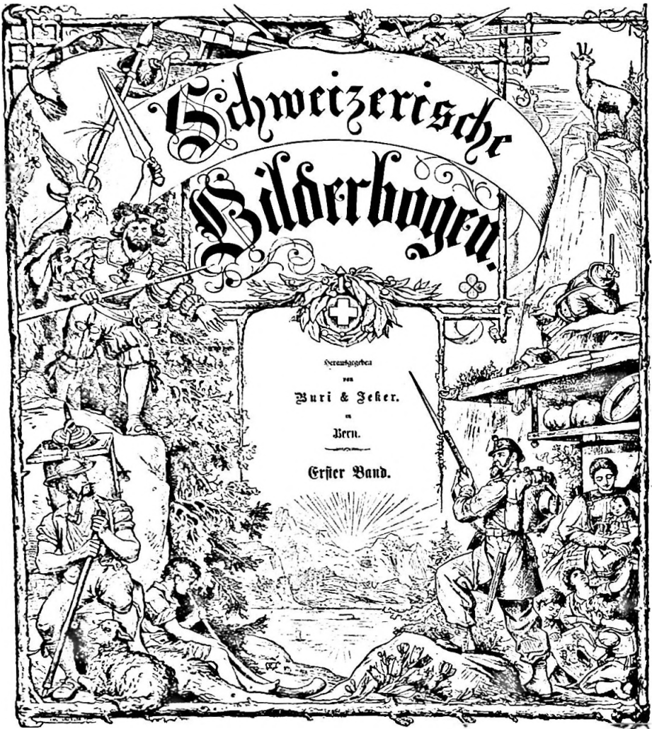
Bild 11. Titelbild «Schweizerische Bilderbogen». Hg. von Buri und Jeker, Bern 1874—76, Inv. Nr. 2135.

Mit den schweizerischen Bilderbogen hofften die Herausgeber eine populäre Bilderserie zu schaffen, wie es deren verschiedene in anderen Ländern gab. Besonders die auch in der Schweiz beliebten Münchner Bilderbogen