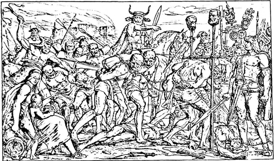
Bild 14. Diviko schickt die Römer unter das Joch. In: Die Schweizergeschichte in Bildern. Hg. von Müller-Landsmann 1886. Signiert im Druck «K. JAUSLIN 1885».

von Buri und Jeker nach verschiedenen Vorlagen, zum Teil nach älteren und neueren Ölgemälden in Holzstiche übertragen lassen. Im Vorwort zur erweiterten Ausgabe unterstreicht der Verleger die Bedeutung des hinzugekommenen Textes: dieser solle «ein vaterländisches Evangelium sein, das immer und immer wieder zu begeistern und zu entflammen vermag, damit aus dem Worte die That erwachse.»