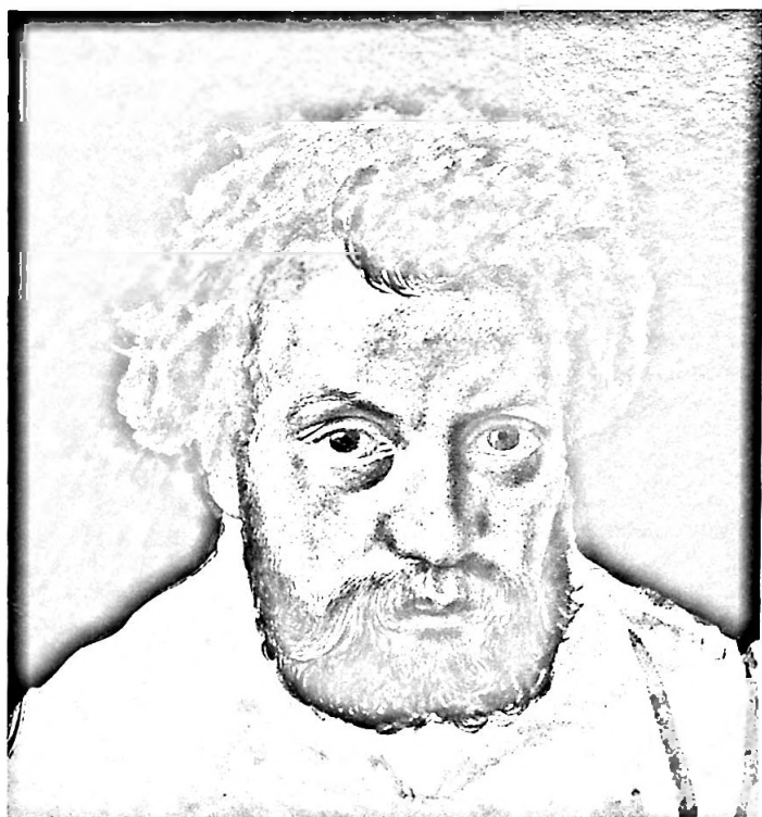
Bild 4. Selbstbildnis, wohl vor 1870, Aquarell, Blattgrösse 22,5 x 20 cm, Inv. Nr. 1458.

schichtliche Werke Tafeln zeichnete 13 . Obwohl er äusserst anspruchslos lebte, reichte das selbstverdiente Geld nicht immer. Mutter und Schwestern unterstützten den Sohn und Bruder, für dessen Nöte sie viel Verständnis aufbrachten und auf den sie stolz waren. Wohl fiel es Jauslin schwer, das sauer verdiente Geld aus Muttenz anzunehmen, doch hoffte er fest, dereinst für die Seinen sorgen zu können, was er dann in späteren Jahren auch ebenso selbstlos tat.