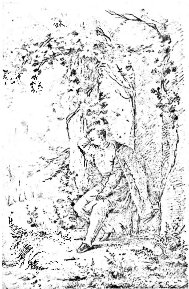
Bild 3. Selbstbildnis aus dem Skizzenbuch von 1868, Bleistift, 10,5 x 17 cm, signiert «K. Jauslin», Inv. Nr. 2104.

Die düstere Gestimmtheit hatte nicht nur in Jauslins unglücklicher beruflicher Situation ihren Grund. Hinzu kam, dass seine Freundin mit ihrer Familie nach Amerika auswandern musste. Jauslin konnte ihr nicht folgen, da er für Mutter und Schwestern zu sorgen hatte. Die Trauer um die verlorene Liebe begleitete Jauslin noch lange Jahre und war nach seiner eigenen Aussage der Grund dafür, dass er ledig blieb.