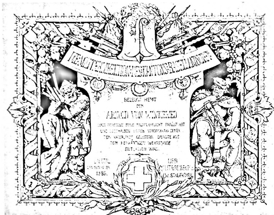
Bild 17. Entwurf für Entlassungsurkunde aus dem Militärverband, Bleistift, 23 x 28 cm, signiert «KARL JAUSLIN 1878», Inv. Nr. 756.

Anklang. Sie richteten sich nicht an eine bestimmte gesellschaftliche Gruppe, sondern waren im besten Sinne des Wortes volkstümlich. Nicht umsonst erlebten sie mehrfache Auflagen und manche von ihnen wurden auch in Zeitschriften und Kalendern veröffentlicht.