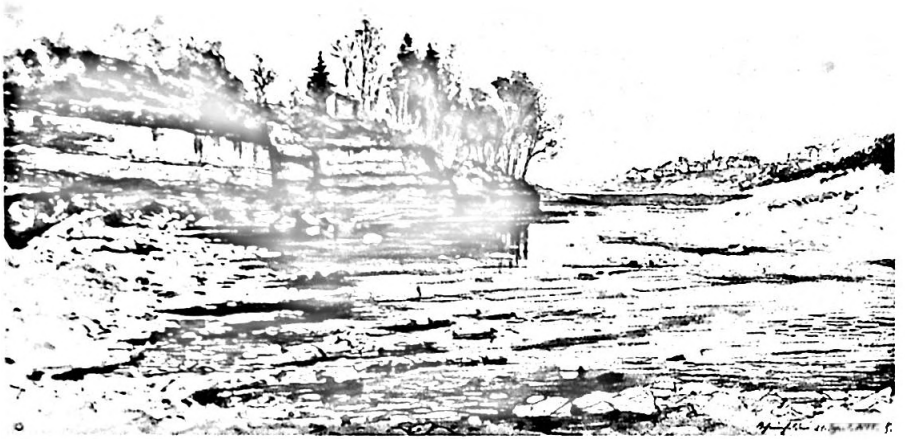
Bild 21. Ufer bei Rheinfelden, Aquarell, 18 x 29 (Passepartout), signiert «Rheinfelden den 21. April 1885 K. Jauslin», Privatbesitz MuttENZ.

Offensichtlich besass Jauslin eine Vorliebe für Aquarellfarben. Seine Aquarelle lassen sich in zwei Gruppen einteilen: in jene zumeist grossformatiger, sehr sorgfältig kolorierter Zeichnungen (hier handelt es sich vor allem um die schon erwähnten «Aquarellkopien» der «Bilder aus der Schweizergeschichte» und in jene Gruppe kleinformatiger Blätter, deren Sujet gar nicht oder nur flüchtig vorgezeichnet ist.