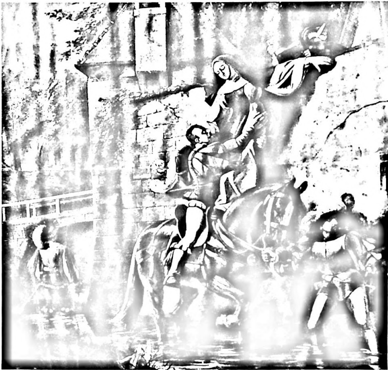
Bild 22. Der Nonnenraub im Kloster Engenthal, Öl auf Leinwand, 265 x 268 cm, signiert «KARL JAUSLIN September 1900».

Zwei Muttener Wirtshäuser schmückte Karl Jauslin mit Bildern aus, sein Stammlokal, die «Bierhalle», und den inzwischen abgebrochenen «Bären».