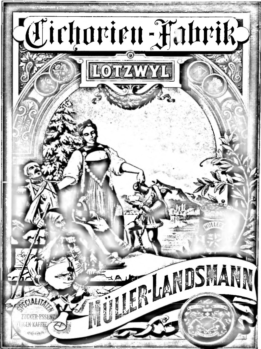
Bild 18. Reklameplakat, Chromolithographie, 63 x 48,5 cm, Inv. Nr. 549.