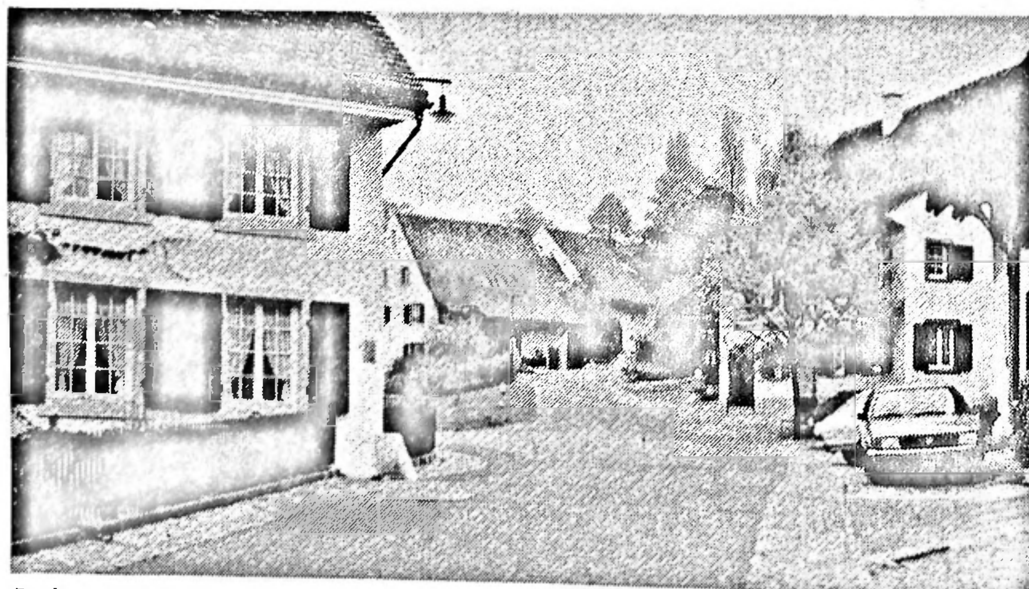
Dank umsichtig betriebener, heuer mit dem Wakker-Preis honorierter Ortsplanung konnte Muttenz — auf unserem Bild die Burggasse — im Kern viel von seinem ursprünglichen Cachet wahren. Der Friedhof der Vorortsgemeinde beherbergt eine Sammlung alter Grenzsteine.

Die Siedlung am Fusse des Wartenbergs wurde 1226 erstmals urkundlich erwähnt, als Besitz des Strassburger Domkapitels. Zahlreiche Funde bezeugen aber die kontinuierliche Be-siedlung seit dem Neolithikum. Die Kirche, die dem heiligen Arbogast, dem ersten fränkischen Bischof von Strassburg, geweiht ist, geht auf eine Stiftung des Strassburger Domstifts zurück. Sie wurde im fünfzehnten Jahrhundert befestigt und ist die einzige noch erhaltene Kirchenan-lage dieser Art in der Schweiz.