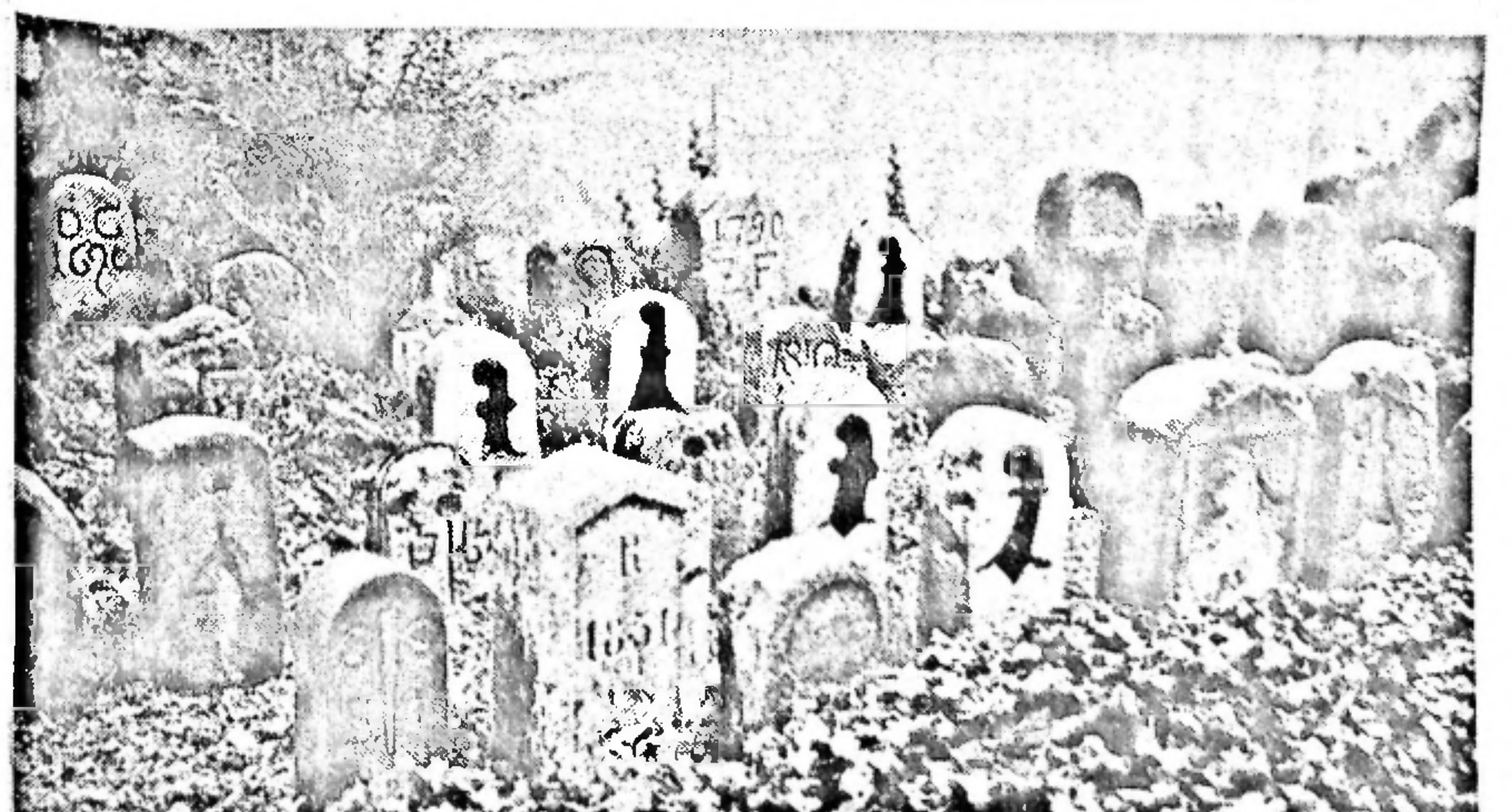
Bild die Burggasse — im Kern viel von seinem ursprünglichen Cachet wahren. Der Friedhof der Vorortsgemeinde beherbergt eine Sammlung alter Grenzsteine.

Ein Saal ist dem Historienmaler und Illustra-tor Karl Jauslin gewidmet. Der Muttenzer Künstler, der von 1842 bis 1904 lebte, wurde vor allem durch seine «Bilder aus der Schweizer Geschichte» bekannt. Neben grossformatigen Tableaus umfasst die Sammlung auch zahl-reiche Skizzen, Plakate und Entwürfe für Fest-umzüge, darunter zu jenem, der im Jahre 1898 zur Eröffnung des Schweizerischen Landesmu-seums in Zürich inszeniert wurde. Die gezeigten Werke stammen zur Hauptsache aus dem Nach-lass der Schwester von Karl Jauslin, die diesen testamentarisch der Einwohnergemeinde von Muttenz vermacht hatte.