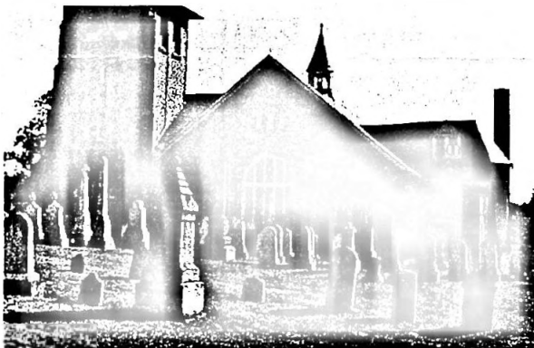
Das obige Bild zeigt die St. Jacobs Reformierte Kirche in der Brodbeck Township, Grafschaft York, Pennsylvanien