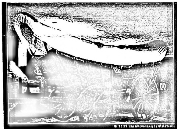
Ein klassischer Conestoga Wagen, wie er im "Smithsonian Institute" (Museum) in Washington, D. C. ausgestellt ist.

Dieser Conestoga Wagen erwies sich anfänglich als Versager, weil die Grenzstrassen so primitiv waren. Als sich die Region jedoch entwickelte, wurde der Wagen sehr populär.