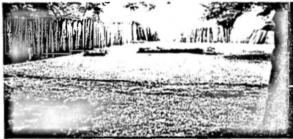
Der Moravian Fort in Bethabara, Nord Karolina