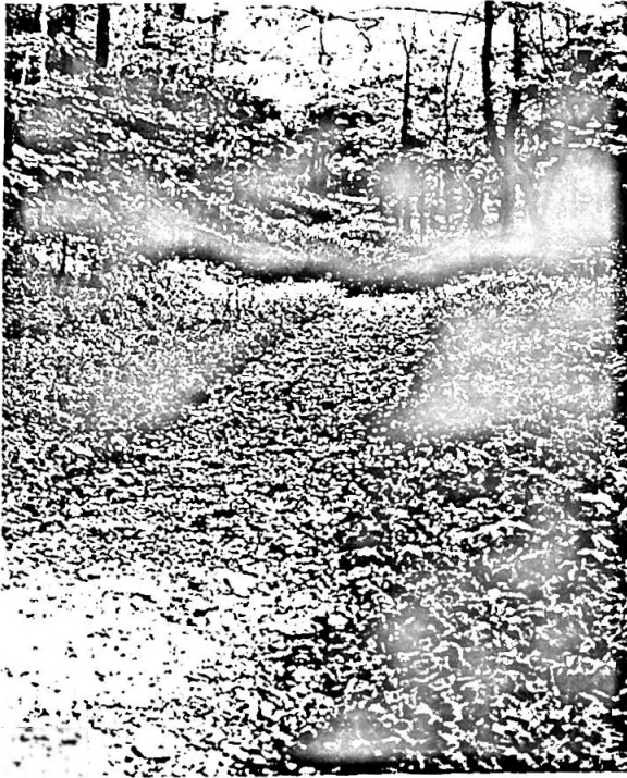
Ein Pfad längs der alten Wildnis Strasse durch den Cumberland Graben. Dieses Photo wurde auf der Westseite aufgenommen, unterhalb der Anhöhe über dem Graben. Der US Park Service plant, den alten Pfad als Teil des National-Parks zu restaurieren, um die historische Wichtigkeit dieses Weges nach der "westlichen Wildnis" zu markieren.