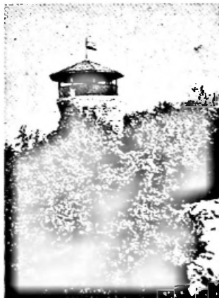
Dem Aussichtsturm erstellte der VVM im Sommer 1901 ein Dach.

Sehenswürdigkeiten: Die Burgkirche St. Arbogast mit Ringmauer, das Beinhaus mit Holzdecke und Malereien von 1513, die Grenzsteinsammlung im Kirchhof. - Schöne alte Häuser, die 800 m lange Hauptstrasse, die gut erhaltenen Brunnen, das Ortsmuseum und ein Bauernhausmuseum. - Das Gemeindezentrum Mittenza und die gepflegten Aussenquartiere. - Der Rangierbahnhof, der Rheinhafen Au und das Reiterstadion Schänzli, die Siedlung Freidorf.