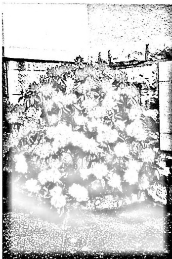
Blumen in den Aussenquartieren