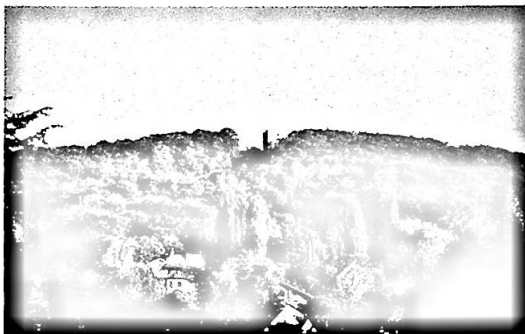
Wartenberg mit Ruine