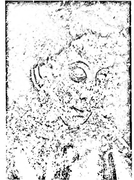
Kopf eines auferstehenden Jünglings, Freilegungsprobe vom Jüngsten Gericht an der Westwand der Kirche von MuttENZ. 1507