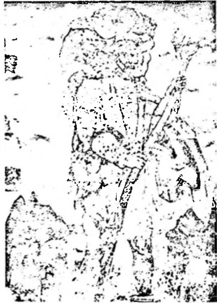
Heiliger Christophorus, Wandbild am Beinhaus von MuttENZ. 1513