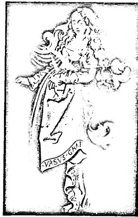
Fragment einer Wappenscheibe von Urs Graf. Um 1508. Schweizerisches Landesmuseum Zürich

Im Schiff der Kirche bietet sich ein noch interessanterer Vergleich an. Es geht um einen Ausschnitt aus dem von Karl Jauslin nach 1880 übermalten Weltgerichtsbild im Westen über der Empore, das bis auf einige kleinformatige Proben einzig nicht freigelegt und konserviert worden ist. Dies ist zu bedauern, auch wenn der Beschauer das riesige Gemälde nicht geniessen kann, da die überdimensionierte Orgel davor steht. Während die jetzt restaurierten Wandbilder an den Seitenwänden mit vielen Hicken versehen waren, damit zweimal der Verputz angebracht werden konnte, ist das grosse Jüngste Gericht unter der Übermalung von Jauslin in der originalen Fassung erhalten