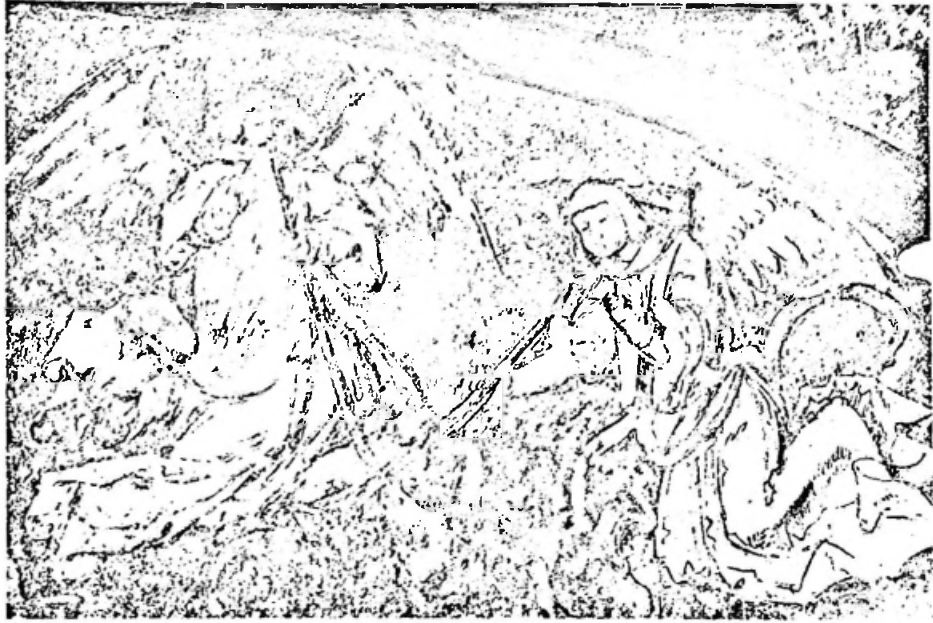
Engel aus dem Jüngsten Gericht im Beinhaus von MuttENZ, 1513

einmal zwischen ungestüme künstlerischer Betätigung und ausschweifendem Reisläufertum ab.