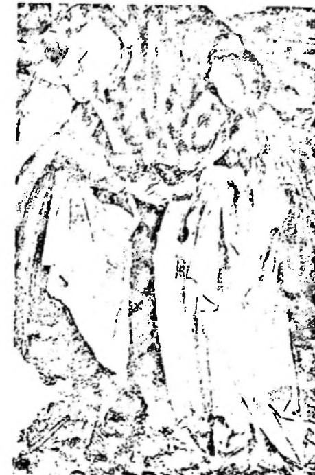
Begegnung von Maria und Elisabeth, Ausschnitt aus einem Wandbild an der Südwand der Kirche von Muttenz. 1507

geblieben. Wir stellen einander gegenüber den freigelegten Kopf eines auferstehenden Jünglings und der Federzeichnung in Tusche mit dem Antlitz eines jungen Mannes. Das kostbare Blatt aus dem Kupferstichkabinett in Basel ist gegenwärtig im Kunstmuseum Basel ausgestellt. Es trägt die Signatur Grafs VG und die für die Frühwerke typische Boraxbüchse und dürfte in der Zeit um 1507 entstanden sein. In Form und Ausdruck sind Auge und Mund bis in Einzelheiten identisch. Dem Ausschnitt aus dem Wandgemälde kommt deshalb besonderes Gewicht zu, weil der Restaurator hier bei der Freilegung bis zur authentischen Malschicht vorgedrungen ist. Übrigens erscheint das Porträt eines jungen Mannes ein zweites Mal im Werk von Urs Graf, diesmal als Halbfigur mit Taschensonnenuhr.