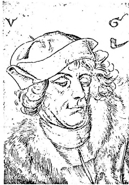
Bildnis eines jungen Mannes, Federzeichnung von Urs Graf. Um 1507. Kupferstichkabinett des Kunstmuseums Basel