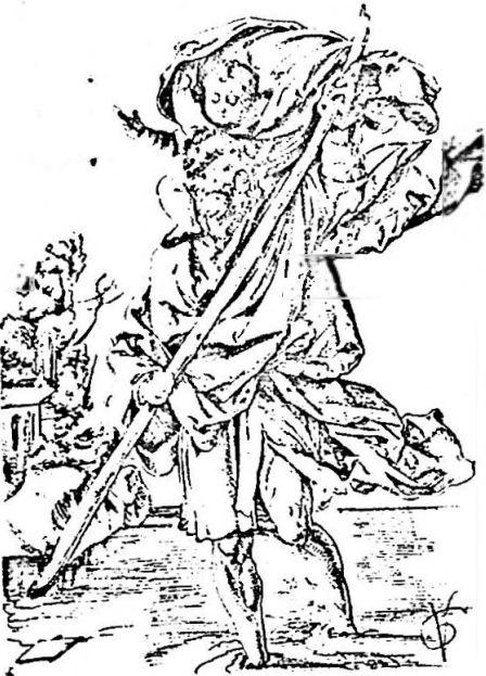
Heiliger Christophorus, Federzeichnung von Urs Graf. Datiert 1513