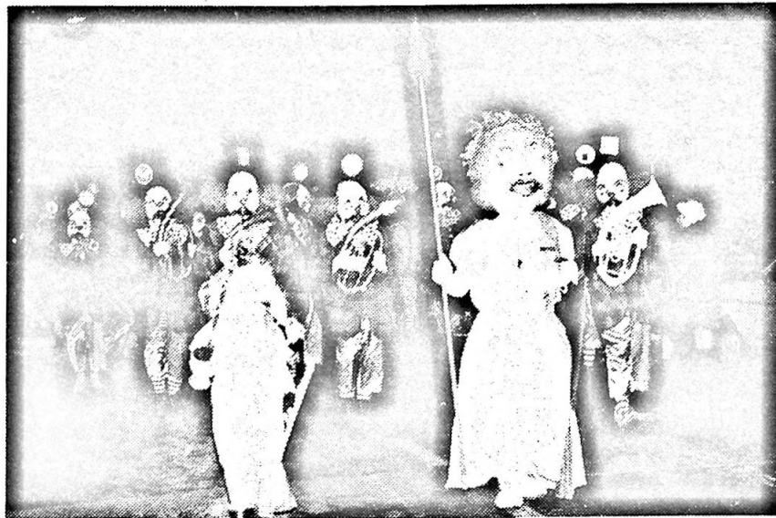
Die Heuwänder-Gugge – traditionell an der Fasnacht dabei.