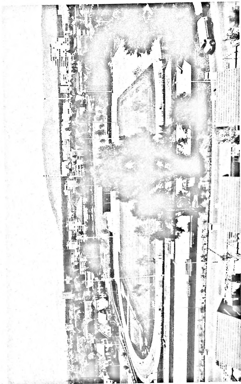
Sportplatzgesamtansicht. Im Vordergrund Hauptspielfeld mit Leichtathletikanlagen – Im Hintergrund Rasentrainingsfelder