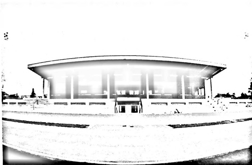
Garderobengebäude mit Tribüne, Südseite