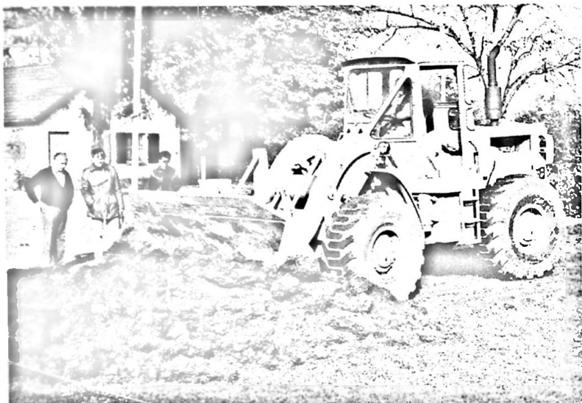
Spatenstich im November 1983