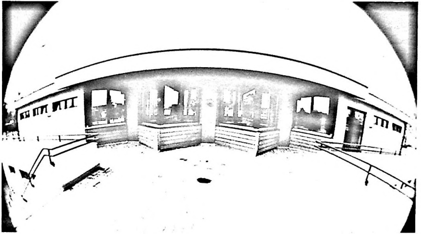
Garderobengebäude Obergeschoss Nordseite