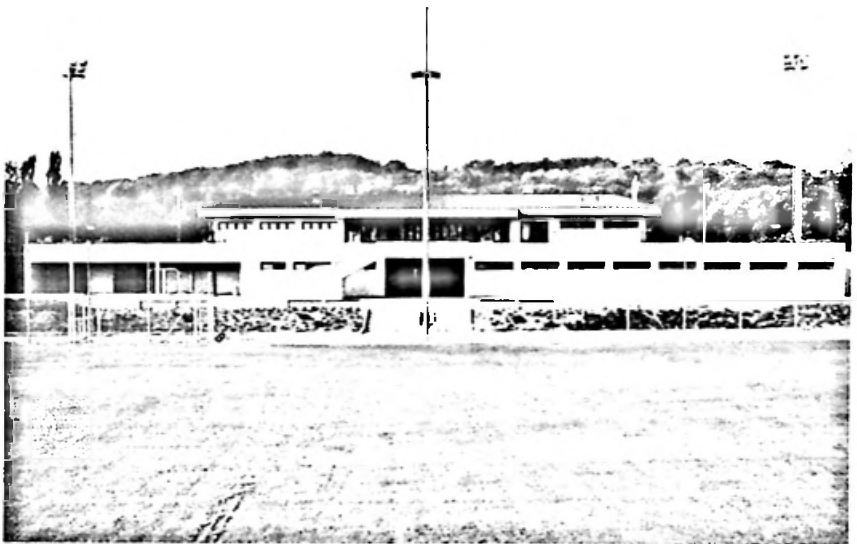
Garderobengebäude Nordseite im Vordergrund Rasentrainingsplätze

Der allgemeinen Umgebungsgestaltung wurde sehr grosse Bedeutung geschenkt. Die vorhandenen Bäume wurden soweit als möglich erhalten und durch intensive, rahmenbildende Neuanpflanzungen ergänzt. Sportler und Zuschauer finden somit in den Randzonen angenehme Schattenplätze. Möglichkeiten für sportliche Leistungen sowie Entspannung im Grünen liegen auf der Anlage nahe beieinander.