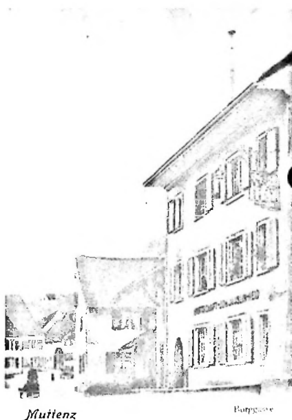
1922 Verlag Gustav Fischer, Wiesbaden, Wiesbaden

Anlässlich der Restaurierung wurde darauf geachtet auch das Innere zu restaurieren und nicht vollständig zu erneuern. Vor allem die Wirtsstube mit der alten Holzdielendecke und die übrige Ausstattung verleihen dem Innern eine stilvolle Atmosphäre. Während auf der Vorderseite die Gebäudegruppe durch die Entfernung der Balkone gewonnen hat, gewann die Rückseite durch Holzerker, Lauben und neue Giebelkonstruktionen, die vor allem zur Belichtung der neuen Wohnungen dienen und sich geschickt in die Muttenzer Hinterhofarchitektur einfügen. Jedenfalls ist es hier gelungen, die historische Substanz nicht nur aufzuwerten, sondern durch bescheidene Erneuerungen zu ergänzen. Mit der Restaurierung des Schlüssels durch die Bürgergemeinde hat Muttenz nicht nur eine Dorfbeiz gewonnen, sondern einen gewichtigen Bestandteil der spätmittelalterliche Bausubstanz gerettet.»