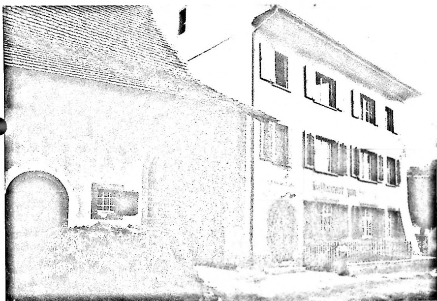
Abb. 4. Das Gasthaus zum Schlüssel. Photo nach 1910 (Museum Muttentz, Bildersammlung).