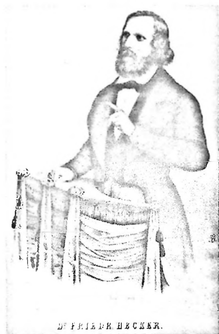
Abb. 7. Friedrich Hecker am Rednerpult. Nach einer zeitgenössischen Lithographie.

Von MuttENZ wanderte Hecker im September 1848 mit seiner Familie nach Amerika aus, wurde in Illinois Farmer und Winzer, war gemeinnützig tätig, nahm Partei für Präsident Abraham Lincoln, machte als Freiwilliger den Sezessionskrieg 1861–1865 auf Seiten