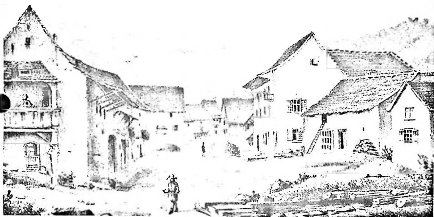
Abb. 1. Burggasse gegen Osten. Rechts Gasthaus «Schlüssel», im Vordergrund der offene Dorfbach.