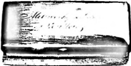
War diese Schnupftabakdose der Mitgliederausweis der Muttener Mittwochgesellschaft?

Besonders zu erwähnen ist der angesehene Reinhard Ramstein, dessen Namen auf der Gründungsurkunde mit einem Kreuz (= gestorben) bezeichnet ist. Er war ursprünglich wie sein Vater Küfer, er übernahm das Restaurant an der Ecke Kirchplatz/Baselstrasse, richtete es 1872 im altdeutschen Stil ein und nannte es «Bierhalle». Er soll als erster Muttener Wirt Bier ausgeben haben. 7 Er bekleidete lange