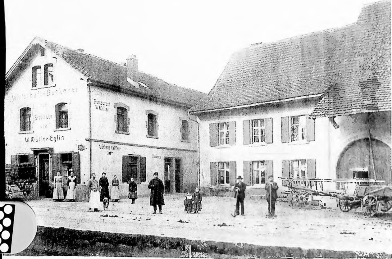
Um das Jahr 1908 befindet sich im westlichen Unterdorf nicht nur die Wirtschaft & Bäckerei zur Brodlaube, sondern auch ein Coiffeur A. Schaub, der im Hinterhaus eingemietet war. Rechts im Bild befindet sich heute das Café Kreisli.