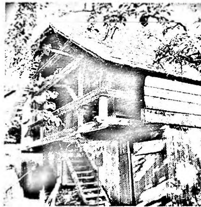
Ofenhaus und Speicher Gebr. Lisser

Über die zahllosen Gerichts- und Kirchenrechtsstreitigkeiten ist hier nicht zu berichten, nur soviel, dass Bern 1539 freiwillig verzichtete, in Mühledorf einen Galgen aufzurichten und Solothurn seinerseits sein Fähnlein vom Brunstock zu Messen beseitigte. Schon früher wurde Prestige gross geschrieben.