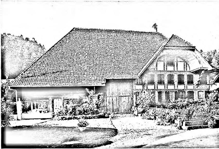
Bauernhaus Andres, von Süden