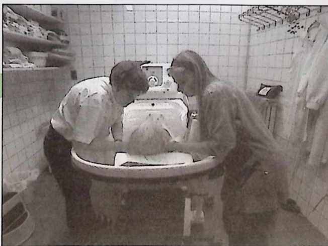
Helpende handen in het Coda Hospice : samen met de verpleegkundigen de levenskwaliteit van patiënten verbeteren.

sionele ondersteuning. Regelmatige interviews en vormingsactiviteiten zorgen ervoor dat de patiënten ook van de vrijwilligers deskundigheid mogen verwachten.