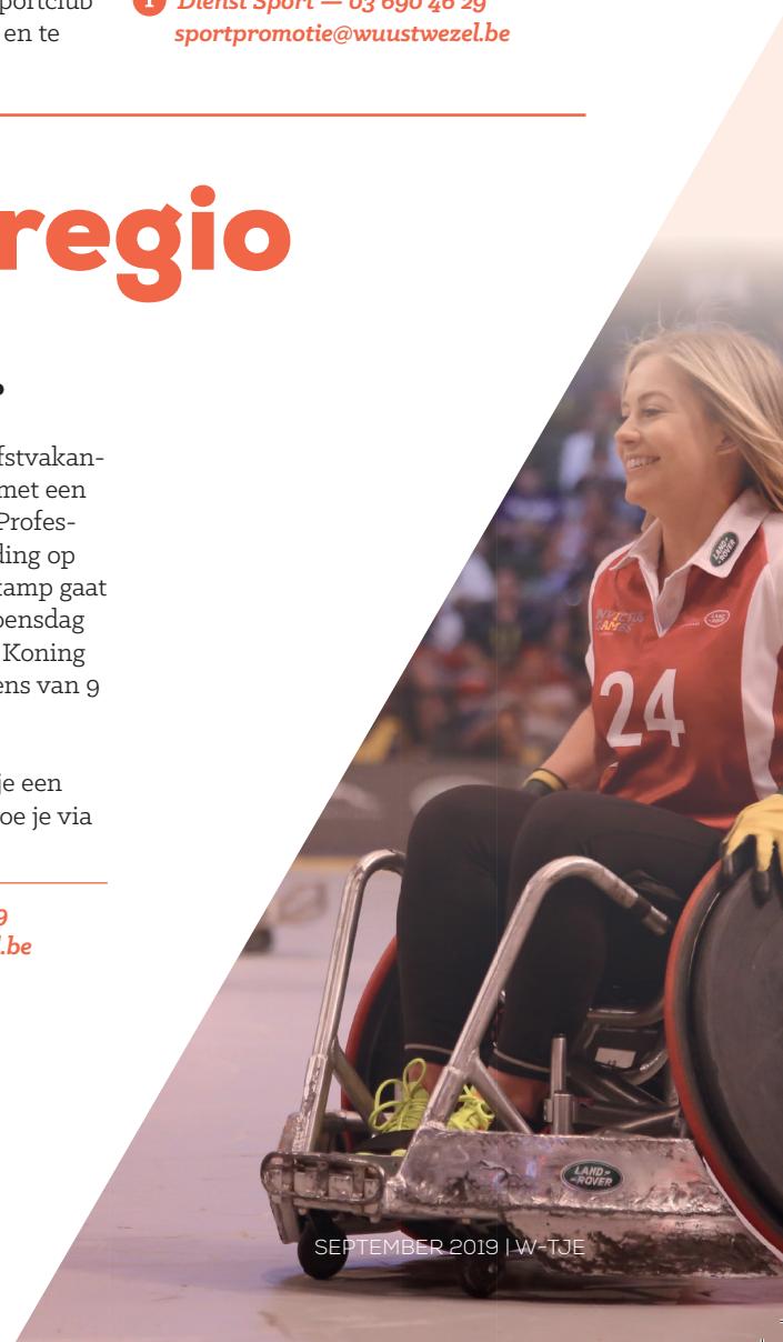
SEPTEMBER 2019 | W-TJE

I Dienst Sport — 03 690 46 29 sportpromotie@wuustwezel.be