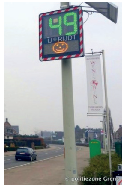
I PZ Grens – 03 620 29 29 info@pzgrens.be