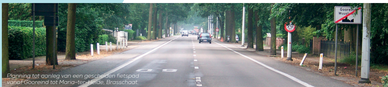
Planning tot aanleg van een gescheiden fietspad vanaf Gooreind tot Maria-ter-Heide, Brasschaat.