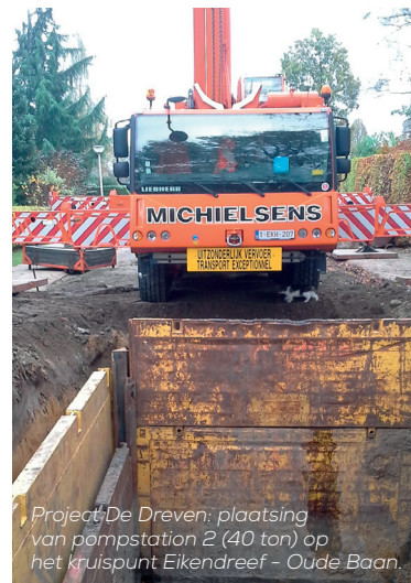
Project De Dreven: plaatsing van pompstation 2 (40 ton) op het kruispunt Eikendreef - Oude Baan.