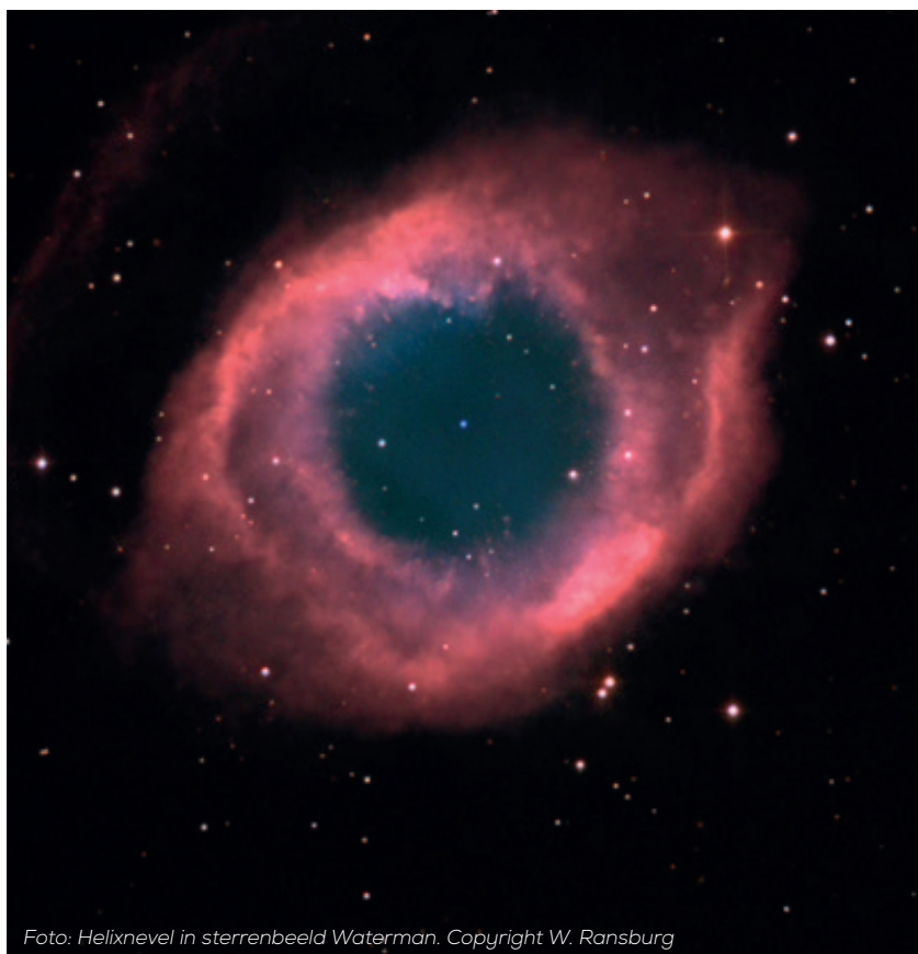
Foto: Helixnevel in sterrenbeeld Waterman.