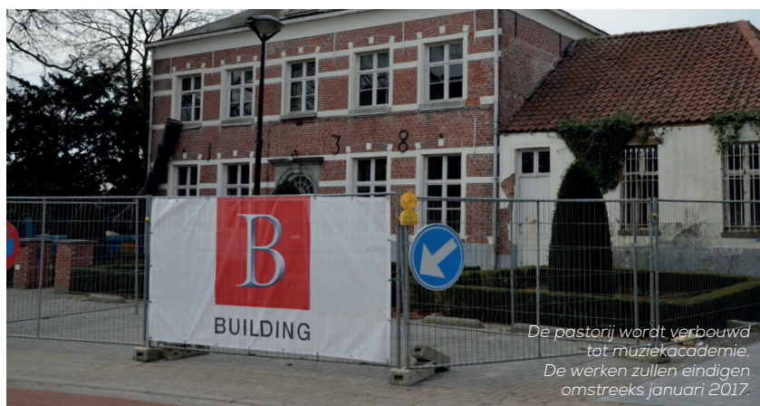
De pastorie wordt verbouwd tot muziekacademie. De werken zullen eindigen omstreeks januari 2017.

2016 wordt een jaar waarin het gemeentebestuur de nodige ruimte heeft om te investeren in wegen, gebouwen en andere gemeentelijke infrastructuur. In het budget werd voor 4.660.240 euro aan investeringen ingeschreven.