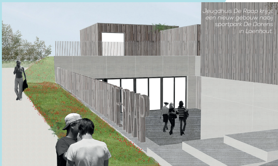
Jeugdhuis De Raap krijgt een nieuw gebouw nabij sportpark De Dorens in Loenhout.