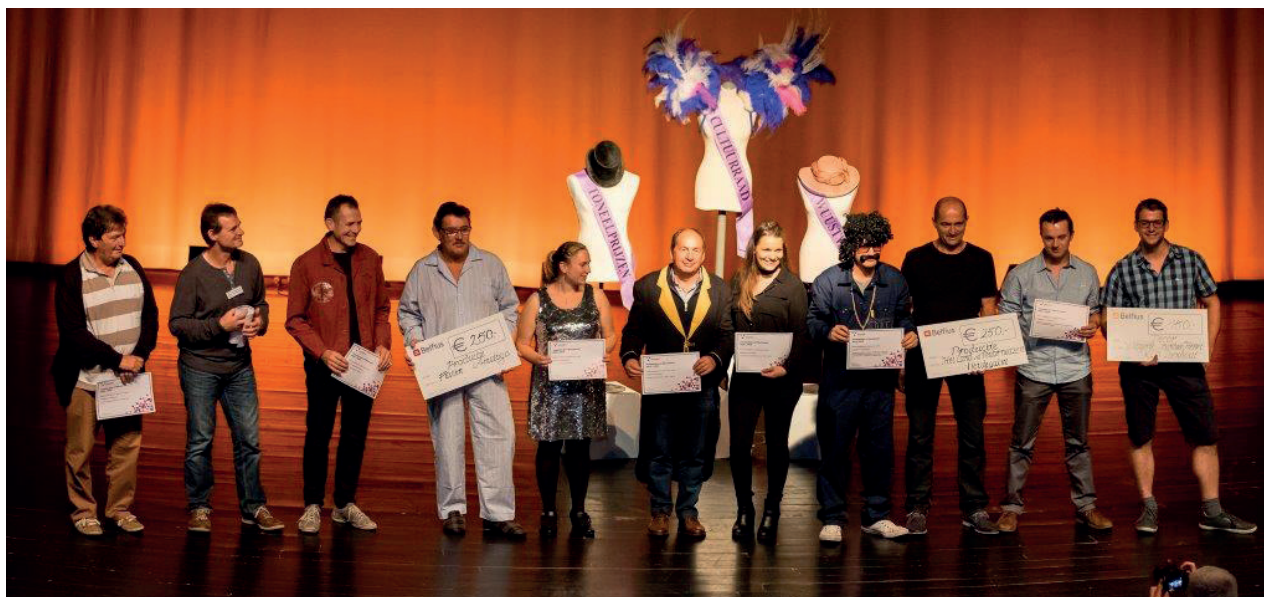
W-TJE | NOVEMBER 2016

i Dienst cultuur – 03 690 46 26 cultuur@wuustwezel.be