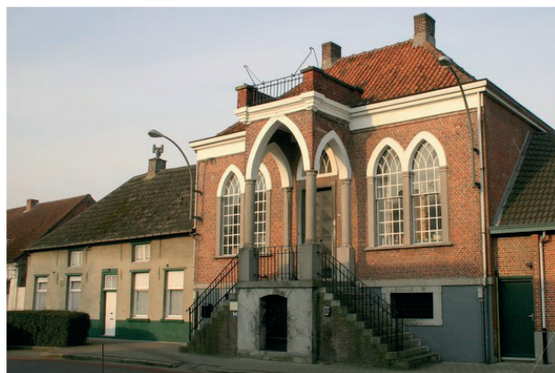
HET OUD-GEMEENTEHUIS VAN WUUSTWEZEL STAAT TE KOOP.

I De gemeentesecretaris 03 690 46 11 secretaris@wuustwezel.be