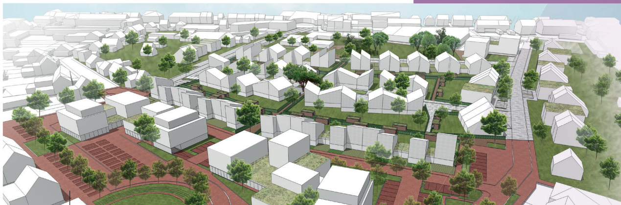
HET BINNENGEBIED 'ACHTER D'HOVEN' WORDT TOT ONTWIKKELING GEBRACHT.

Tussen Dorpsstraat, Kloosterstraat en Bredabaan ligt 6ha ruimte die nog tot ontwikkeling kan worden gebracht. Voor dit binnengebied werd een stedenbouwkundige visie en een beeldkwaliteitsplan ontwikkeld. Op dit ogenblik vinden gesprekken plaats met de verschillende eigenaars. We hopen hen op één lijn te krijgen zodat een verkavelingsplan kan worden voorbereid.