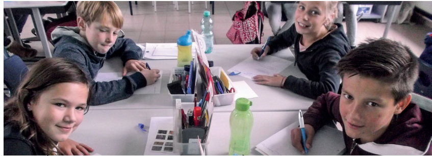
BRIEVEN SCHRIJVEN HELPT ÉCHTI DOE JE OOK MEE?

Ook wij worden uitgenodigd door Amnesty International om deel te nemen aan de schrijfmarathon die georganiseerd wordt van 5 december tot 31 december 2015. Over gans de wereld worden brieven geschreven om aan te kaarten dat de rechten van mensen geschonden worden.