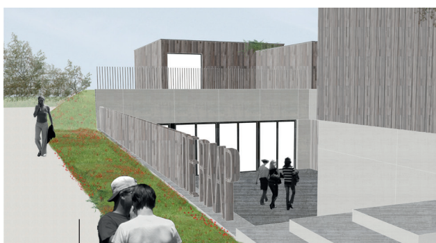
EEN NIEUW JEUGDHUIS VOOR DE JONGEREN UIT LOENHOUT.

In sportpark De Dorens komt er een nieuw jeugdhuis voor de jongeren uit Loenhout. De bouwvergunning werd afgeleverd. De groendienst zal nu de struiken e.d. verwijderen en het perceel bouwrijp maken. Op 31 december wordt de afzuiging geplaatst zodat kort erna gestart kan worden met het uitgraven en het steken van de kelder.