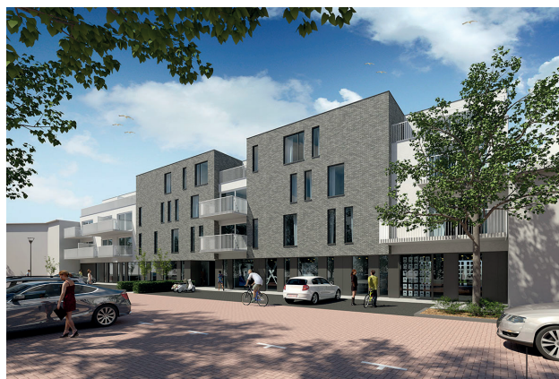
DE OMGEVING VAN DE WISSEL KRIJGT EEN NIEUW UITZICHT.

Sinds de verhuus van Hubo naar de rand van het dorp staat het pand aan De Wissel leeg. Het pand zal gesloopt worden en in de plaats komen er 67 nieuwbouw appartementen, 4 handelruimtes, extra parkeerplaatsen en een fietsdoorgang naar het nieuwe binnengebied Achter d'Hoven. De appartementen worden reeds te koop aangeboden. Meer info op www.dewissel-wuustwezel.be