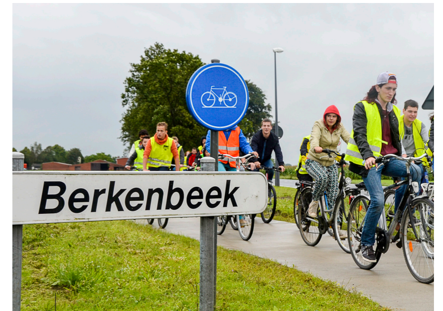
LEERLINGEN VAN BERKENBEEK RIJDEN OVER HET NIEUWE FIETSPAD NAAR SCHOOL.

In deze straten zal het voetpad worden heraanlegd. Op 23 september is aannemer Jaspers uit Essen gestart met de heraanleg van het voetpad in de Kerkhofstraat. Om de hinder te beperken en de toegang tot de opritten zo maximaal mogelijk te houden, wordt er telkens in 'stukken' van ongeveer 100 meter gewerkt. Afhankelijk van de weersomstandigheden zullen deze werken vier tot vijf weken in beslag nemen. Begin november start de aannemer dan in Het Blok. Daar zal gedurende een tweetal weken volgens eenzelfde principe worden gewerkt.