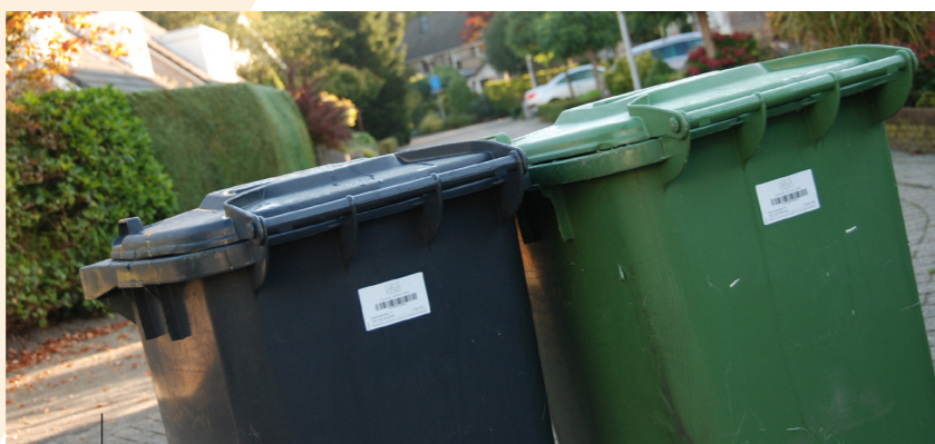
NAAST DE GROENE CONTAINER VERSCHIJNT NU OOK DE GRIJZE CONTAINER IN ONS STRAATBEELD.

Op 1 januari 2016 zetten we in Wuustwezel weer een stap in het DIFTAR-project. DIFTAR staat voor gedifferentieerde tarifiering en werkt volgens het principe van 'de vervuiler betaalt'. Voor de inzameling van het GFT+ stapten we reeds op 1 januari 2014 over naar dit principe. Vanaf 1 januari 2016 zullen we ook voor de inzameling van het huisvuil volgens dit principe gaan werken.