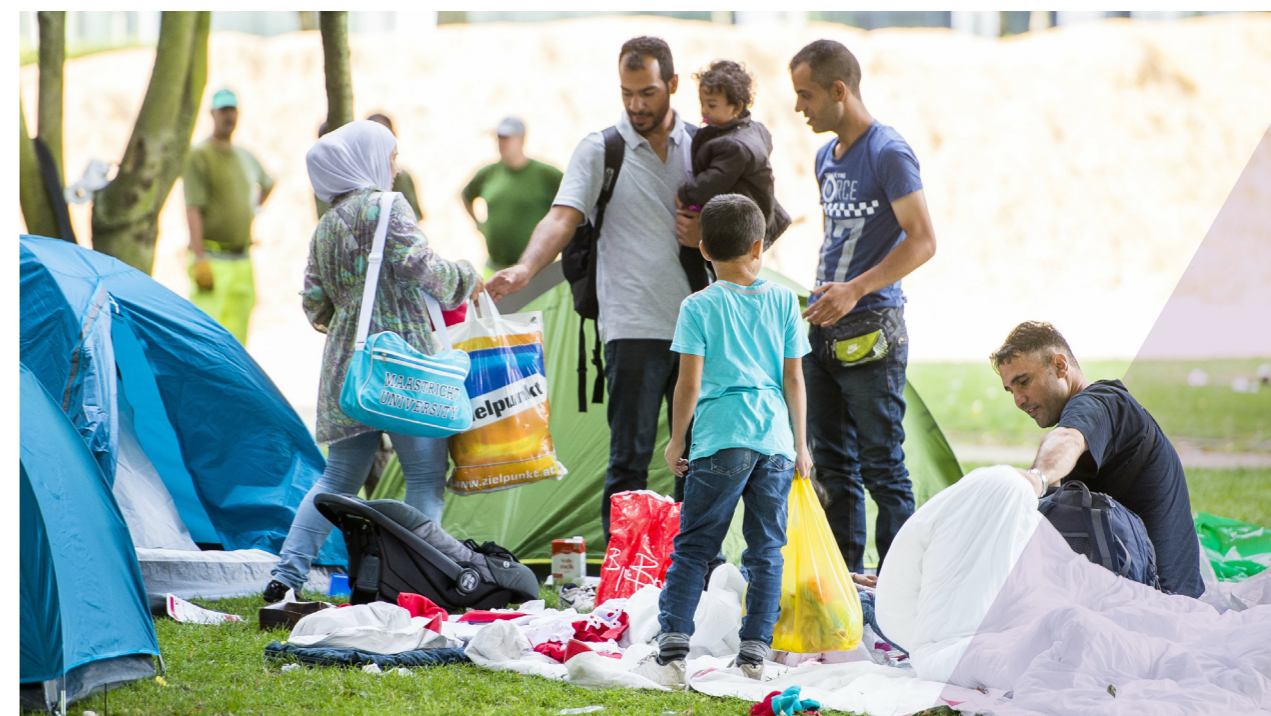
VLUCHTELINGEN BIVAKKEREN IN EEN PARK TE BRUSSEL.