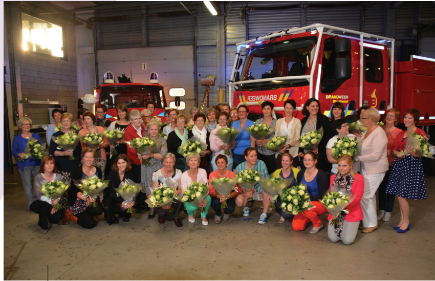
OOK DE VROUWEN VAN ONZE VRIJWILLIGE BRANDWEER WERDEN OP 9 MEI IN DE BLOEMETJES GEZET.

Om zijn werk te kunnen doen in de bossen, beschikt de bosbrandweerwagen verder over goede terreineigenschappen: een winch, een rolkooi, een bullbar, vijf materiaalkasten, twee rugzakken voor transport van slangen, twee blushaspels, een dag/