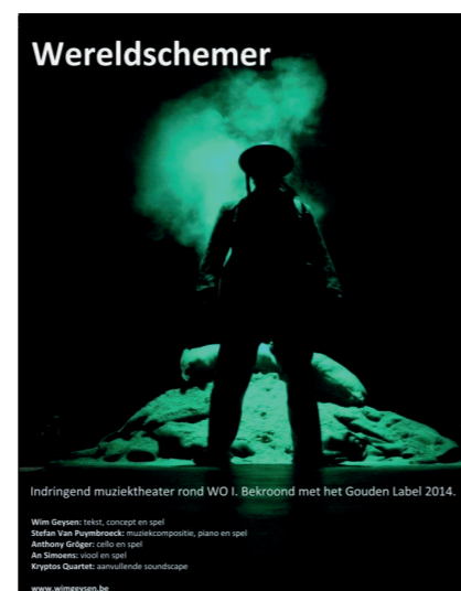
Indringend muziektheater rond WO I. Bekroond met het Gouden Label 2014.

Deze voorstelling is een initiatief van het Beheersorgaan van het Gemeenschapscentrum i.s.m. Werkgroep Grooten Oorlog en is te zien op woensdag 22 april om 20 uur in GC Kadans. Tickets zijn te koop in de vrijetijdswinkel (tel. 03 690 46 43): 10 euro in voorverkoop, of 14 euro aan de kassa.