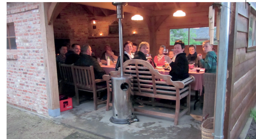
BURENDAG OP DE HEIKENWEG

I dienst vrije tijd – 03 690 46 79 – vrijetijd@wuustwezel.be