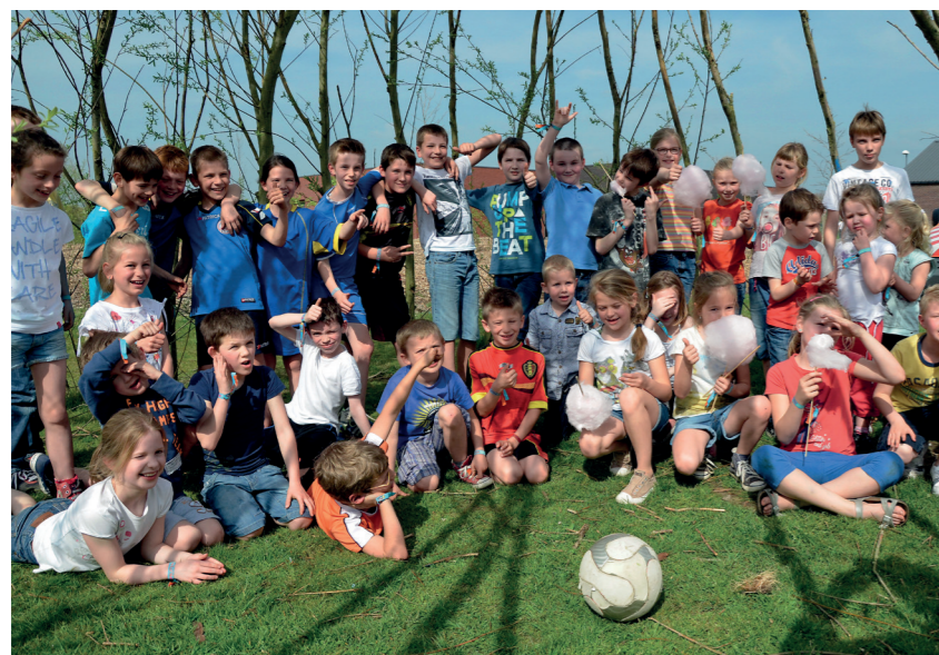
I jeugddienst – 03 690 46 27 – jeugd@wuustwezel.be

Wil je Tuizentflood graag ontmoeten? Kom dan op de Buitenspeeldag (buiten) spelen op speelreintjes in je buurt (zie lijst). Woon je te ver? Geen probleem! Ga dan gewoon lekker buiten spelen, in de straat of in het bos. Als beloning kun je tot de zomervakantie het enige echte 'Ik hou van buitenspeelen'-stoeperkrijt gratis afhalen bij de jeugddienst (op de eerste verdieping in het gemeentehuis) of bij de toeristische dienst in de Poort naar het Platteland.