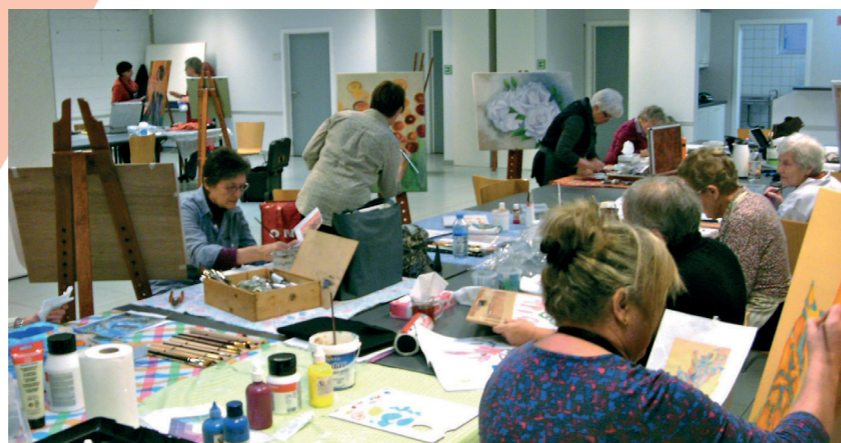
I Vormingspunt Wuustwezel – 03 667 61 58 - vormingspunt@wuustwezel.be

Iedereen is welkom, de toegang is gratis en de deelnemers zijn aanwezig. Er is tijd voor een babbeltje, een hapje en een drankje.