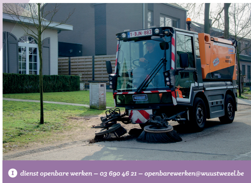
I dienst openbare werken – 03 690 46 21 – openbarewerken@wuustwezel.be

vegen, is de hele straat schoon! Dat is niet alleen prettig voor de inwoners, maar ook voor de bezoekers.