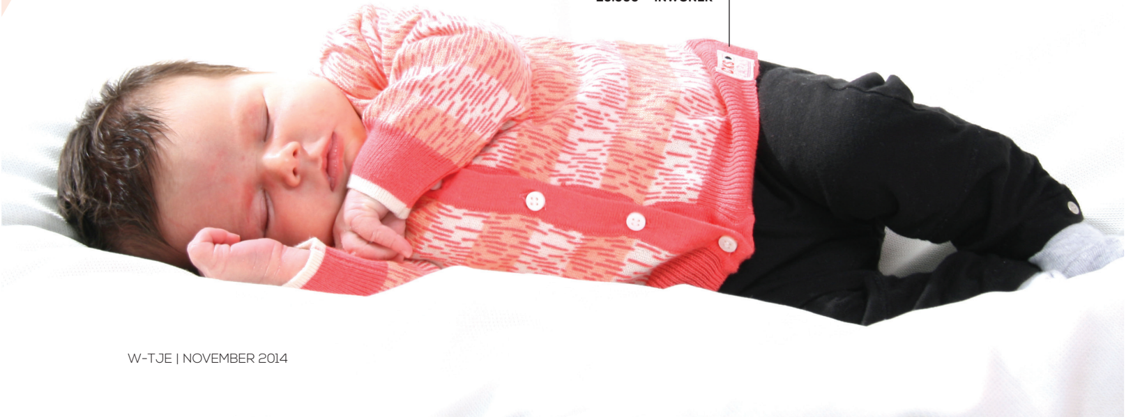
HAZEL RUTS ONZE 20.000 STE INWONER