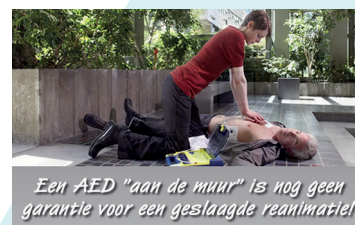
Een AED "aan de muur" is nog geen garantie voor een geslaagde reanimatie!

I dienst welzijn – 03 690 46 14 welzijn@wuustwezel.be