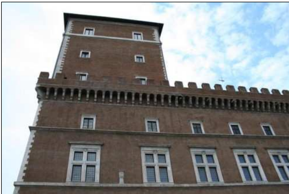
Palazzo di Venezia

Palazzo Venezia –più precisamente Palazzo di Venezia- è stato costruito a partire dal 1455 per volere del cardinale veneziano Pietro Barbo, che verrà eletto pontefice nel 1464 con il nome di Paolo II . È la prima grande opera di architettura civile realizzata dal rinascimento a Roma. Il palazzo diventerà nel 1564 sede dell'ambasciata di Venezia dopo essere stato per anni residenza papale. Questo rafforzerà ancor più il legame di questo luogo con la figura di San Marco.