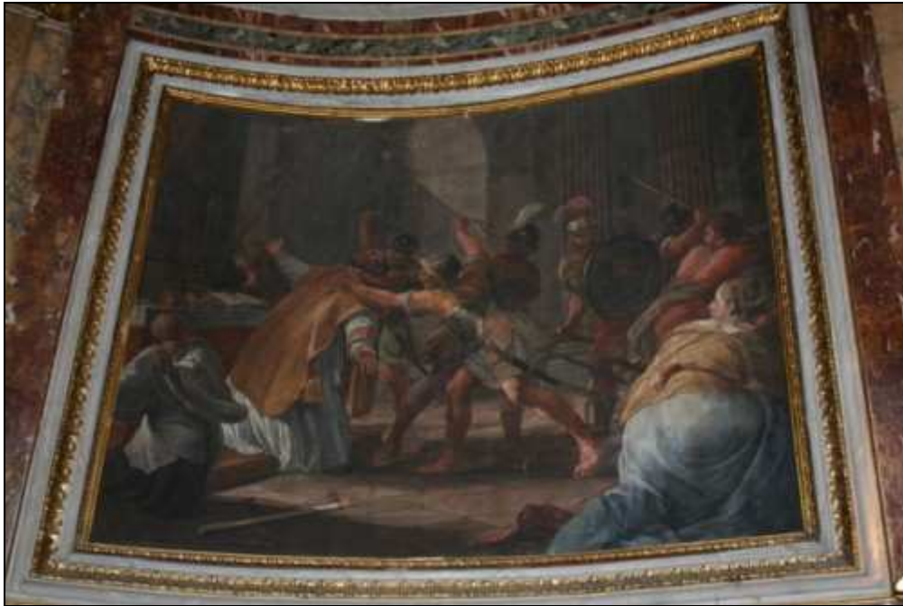
Affresco destro dell'abside: la cattura di San Marco ad Alessandria d'Egitto, mentre celebra (Borgognone)

L'affresco al centro è, invece, opera seicentesca del Romanelli, discepolo di Pietro da Cortona, e rappresenta San Marco evangelista (e con lui della repubblica di Venezia) che, a destra, sconfigge il paganesimo ed, a sinistra, esalta la vera fede, sotto la quale si intravede la città lagunare. Queste immagini mutuano dalla pittura classica e rinascimentale molti stilemi.