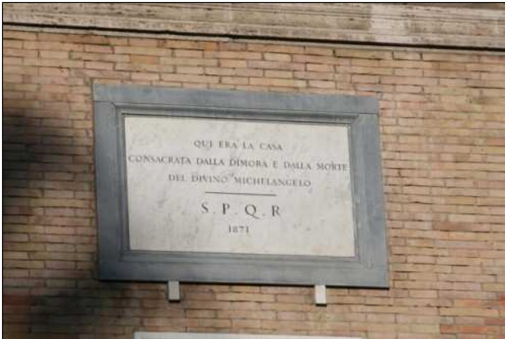
Lapide che ricorda l'ubicazione della casa di Michelangelo

Giungiamo all'ultima tappa di questa nostra giornata, alla Colonna traiana.