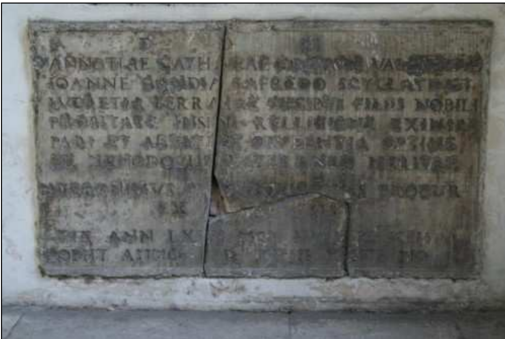
Lapide funeraria di Vannozza Catanei

C'è una lapide, invece, del periodo rinascimentale che è particolarmente interessante. Non era questa la sua sede originaria perchè era precedentemente a Santa Maria del Popolo, ma è stata poi murata nella parete destra interna del portico in cui ci troviamo. È la lapide di Vannozza de' Catanei (1442-1518), amante di Alessandro VI (Rodrigo Borgia), madre di Lucrezia Borgia e di Cesare (il Valentino); sono ancora leggibili nella lapide il suo nome e quello dei suoi figli. Di Alessandro VI parleremo, quando arriveremo con il nostro corso sulla storia della chiesa al periodo rinascimentale.