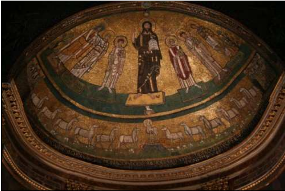
San Marco: mosaico absidale di Gregorio IV (ca.833 d.C.)

Abbiamo una lettera che papa Adriano I (772-795) scrive a Carlo Magno descrivendo questo mosaico precedente che è andato perduto e che era di soggetto apocalittico, con la presenza del Cristo poi S.Pietro e S.Paolo, poi ancora Felicissimo ed Agapito ed, infine, i papi Marco e Sisto II.