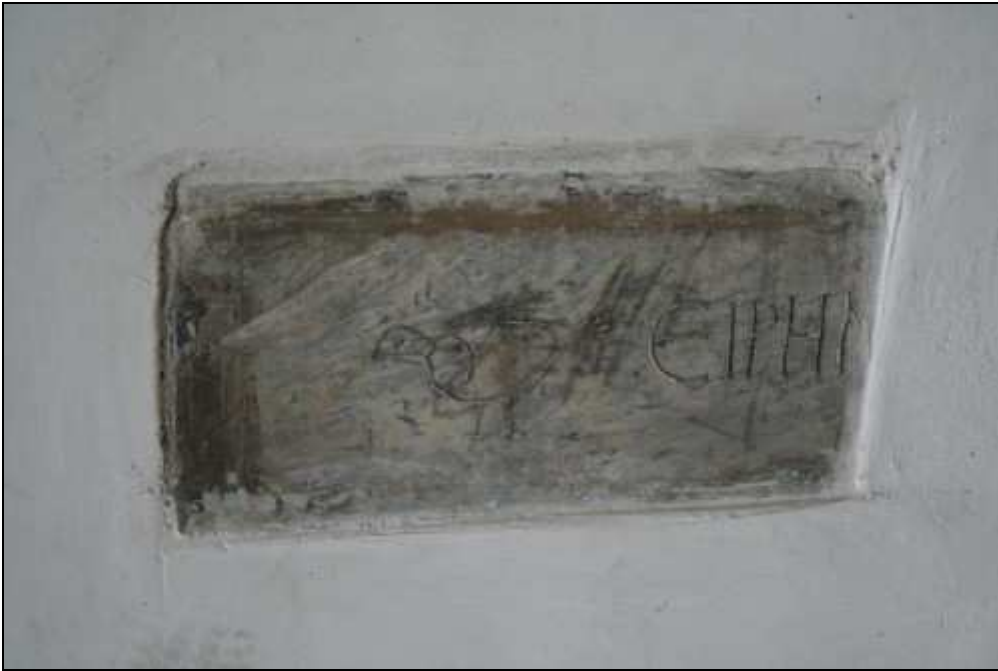
Iscrizione greca nel portico, con la scritta "eirene", pace, ed una colomba, simbolo dell'anima del defunto

C'è una lapide, invece, del periodo rinascimentale che è particolarmente interessante. Non era questa la sua sede originaria perchè era precedentemente a Santa Maria del Popolo, ma è stata poi murata nella parete destra interna del portico in cui ci troviamo. È la lapide di Vannozza de' Catanei (1442-1518), amante di Alessandro VI (Rodrigo Borgia), madre di Lucrezia Borgia e di Cesare (il Valentino); sono ancora leggibili nella lapide il suo nome e quello dei suoi figli. Di Alessandro VI parleremo, quando arriveremo con il nostro corso sulla storia della chiesa al periodo rinascimentale.