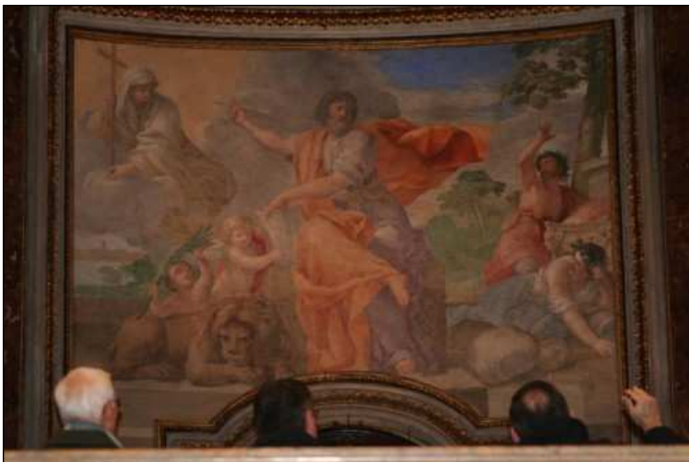
Affresco centrale dell'abside: San Marco, il trionfo della fede e la sconfitta del paganesimo (Romanelli, 1617-1663)

L'affresco al centro è, invece, opera seicentesca del Romanelli, discepolo di Pietro da Cortona, e rappresenta San Marco evangelista (e con lui della repubblica di Venezia) che, a destra, sconfigge il paganesimo ed, a sinistra, esalta la vera fede, sotto la quale si intravede la città lagunare. Queste immagini mutuano dalla pittura classica e rinascimentale molti stilemi.