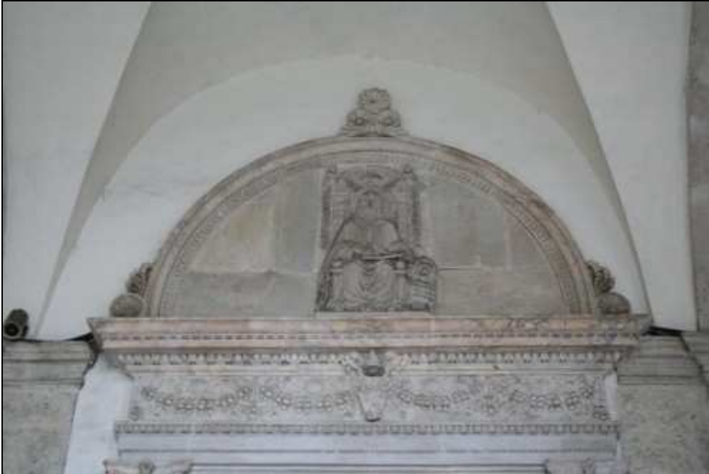
Lunetta del portale con San Marco evangelista di Isaia da Pisa (1464)

Sul portale è scolpito l'evangelista san Marco , seduto sulla cattedra, anche qui con l'attributo iconografico del leone; l'opera è attribuita ad Isaia da Pisa. Nel portico è evidente l'opera fatta realizzare dall'allora cardinale Pietro Barbo. Si possono ammirare, uscendo dalla chiesa, le armoniose linee del portico che reca al piano superiore la loggia delle benedizioni . L'intera opera è attribuita, anche se non con sicurezza, a Giuliano da Maiano.