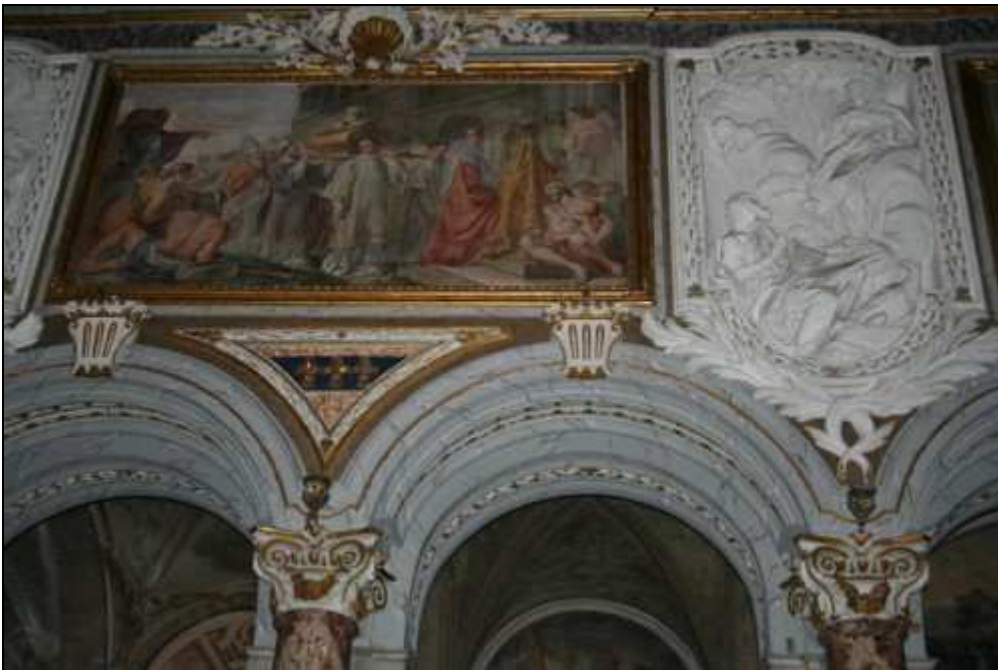
Affreschi della navata: traslazione del corpo di San Marco papa

A sinistra, cominciando dal fondo, il primo raffigura san Marco papa incoronato, lo stesso soggetto che ritroviamo rappresentato anche sulla tavola presente nella cappella del SS.Sacramento, attribuita a Melozzo da Forlì. Poi abbiamo papa Marco che approva il progetto della chiesa dedicata all'evangelista, poi ancora papa Marco che consacra l'altare alla presenza dell'imperatore Costantino, poi ancora la traslazione del corpo di Marco trasportato qui dal castello di Giuliano (1154). L'ultimo affresco vicino all'altare ci riporta ad un episodio della spiritualità veneta ed è precisamente l'ingresso in Venezia di san Lorenzo Giustiniani accolto dal doge.