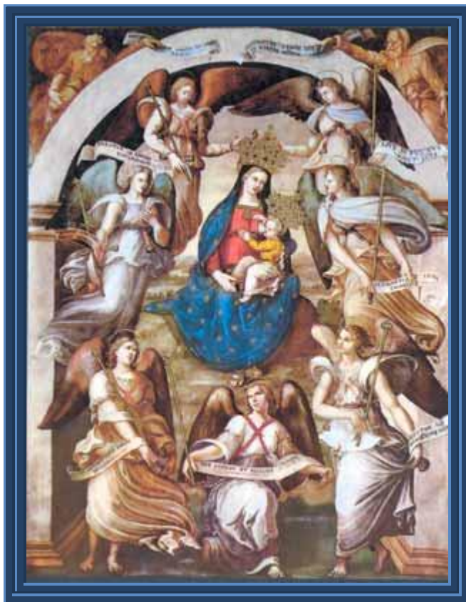
S. Maria degli Angeli - Roma

Questa corona è composta da 49 grani, suddivisi in 7 gruppi separati da 7 grani a forma di rosa e terminanti con 3 grani ed alla fine con una Croce Gloriosa.