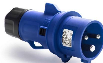
Ref. / Item 13203