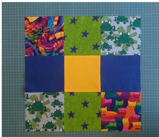
Stik de rijen aan elkaar