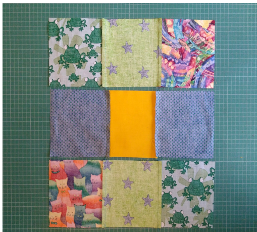
Strijk de naden van de rijen om en om naar buiten en naar binnen