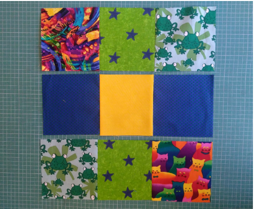
Je rijen zitten nu aan elkaar