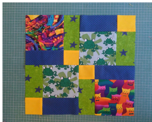
Verwissel de delen links onder en rechts boven en stik de 4 delen aan elkaar.