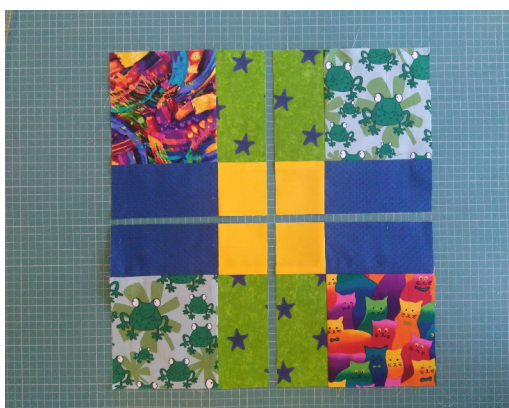
Snijd 1 x in de lengte en 1x in de breedte doormidden