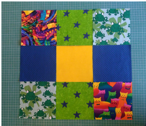
Begin met 9 lapjes