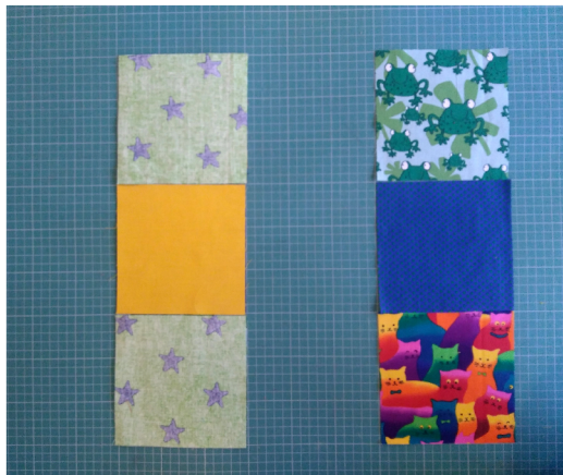
Naai de blokken van de 2 linker rijen aan elkaar