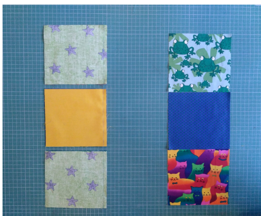
Knip de draad NIET door tussen de blokken