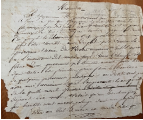
Adresse de Pierre Duboys à l'Empereur (brouillon)

A partir de 1815, sa carrière politique semble s'être ralentie.