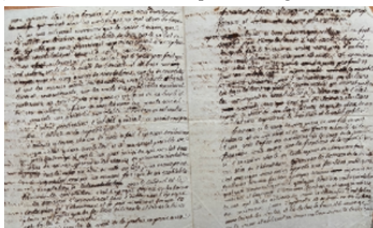
Brouillon, discours Pierre Duboys, 1794

liberté entourée de vertus publiques a présidé à la confection de l'acte constitutionnel [...] ». (cf. annexe 19). Le lendemain Robespierre est guillotiné.