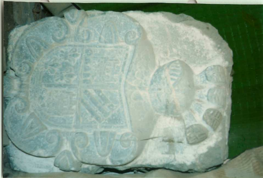
nº.55.-Escudo con las armas del Marqués de Salinas que estuvo colocado hasta su demolición, en la Posada llamada del Marqués, esquina calles Cárcel y Río.