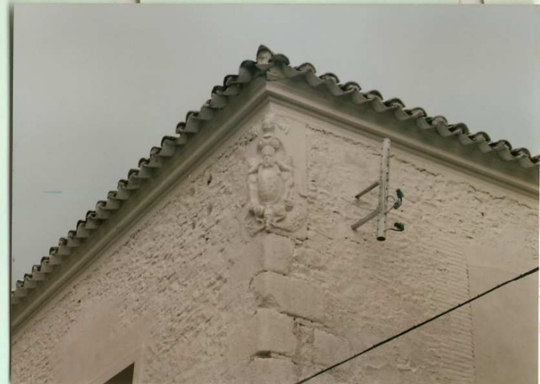
nº.56.-Escudo en la esquina de las calles Monjas, (antes Real) y Carmen, edificio que en el Catastro de la Ensenada de 1.752, estaba recogido como propiedad del Conde de Sevilla la Nueva.