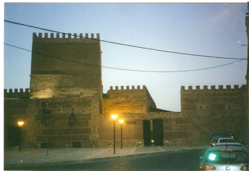
Castillo de Pilas Bonas