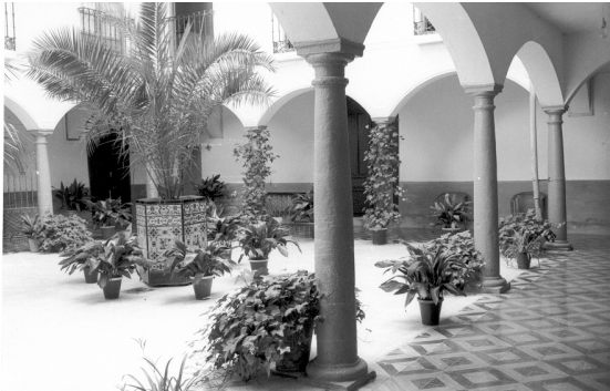
Patio de los Quesada

yglesia mayor y algunas hermitas, y castillo, y otras cosas de las más principales y parientes de los señores naranjos y quesadas."