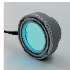
MINI-DOME-60-RGB geschaltet in Mischfarbe / switched in mixed colour