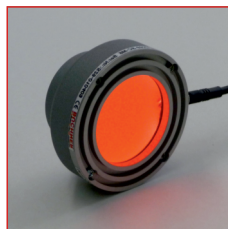
MINI-DOME-60-RGB geschaltet in rot / switched in red