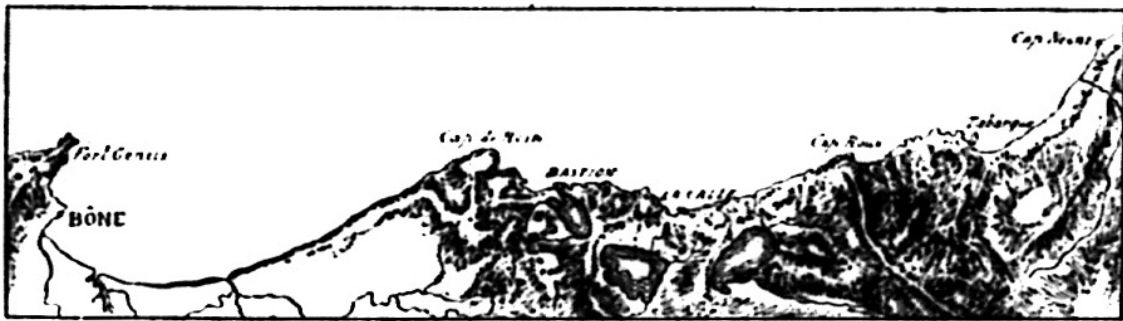
LE LITTORAL DES CONCESSIONS (Partie orientale).

Tandis que la Compagnie royale, négligeant l'ancien comptoir du cap Nègre, fut sans cesse en négociations pour la création de nouveaux établissements en Tunisie et perdit ses efforts en essais inutiles, en Algérie elle se borna à conserver les anciens comptoirs et à les entretenir dans l'état où elle les avait trouvés sans y apporter des transformations que la méfiance des Turcs aurait d'ailleurs rendues difficiles. Même, au XVIII e siècle, le nombre des comptoirs français était moins grand qu'au XVII e puisque le Bastion et le cap de Rose avaient été abandonnés en même temps, en 1677, le premier à cause de son insalubrité, le second parce que le commerce en était tout à fait insuffisant pour la dépense qu'il occasionnait.