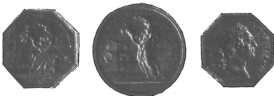
MÉDAILLE ET JETON (2) FRAPPÉS PAR LA COMPAGNIE

Le directeur principal a ajouté qu'il lui paraissait que cette époque de la splendeur de la Compagnie devait être marquée par un hommage au roi, capable d'attirer de plus en plus de la considération à la Compagnie et qu'en remerciant M. de Boynes... on pourrait lui marquer qu'on regarderait, comme une nouvelle preuve de ses bontés, s'il voulait bien faire agréer au roi une médaille d'or que la Compagnie le supplierait de vouloir lui présenter ; ladite médaille ayant la tête