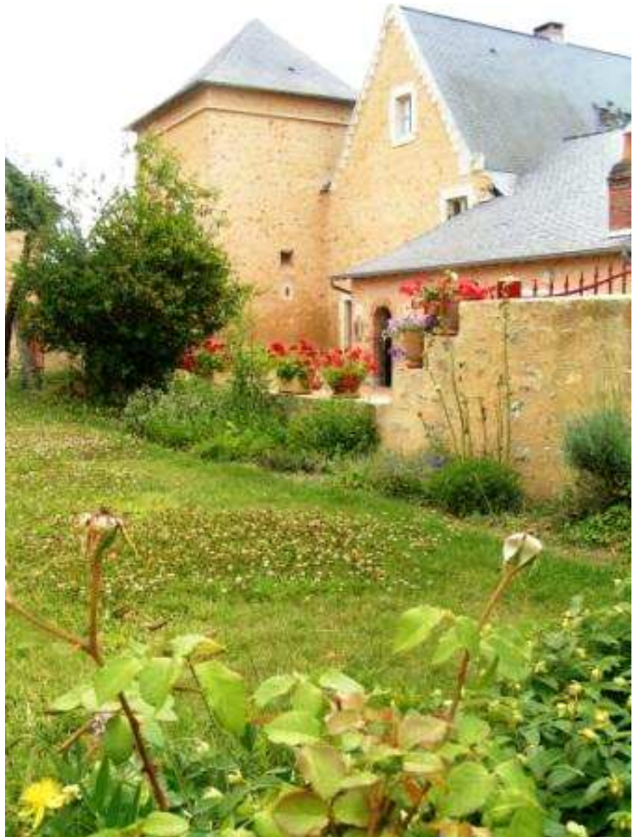
La Commanderie est rue de Morannes, à la sortie du village.